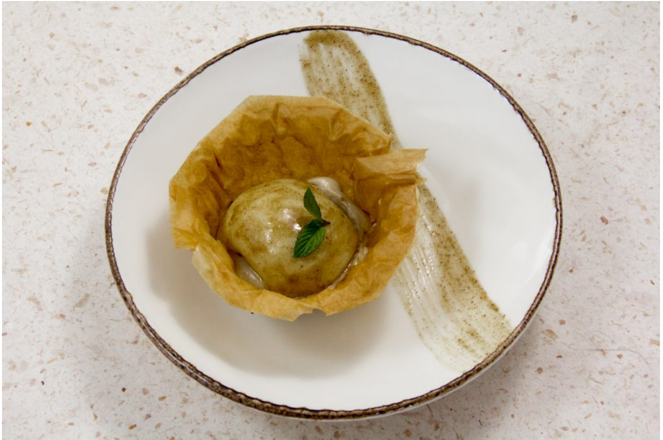
Tarte croustillante aux pommes, crèmeux aux marrons