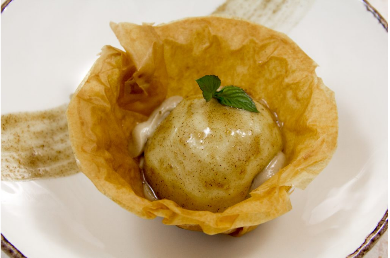
Tarte croustillante aux pommes, crémeux aux marrons

Et c'est prêt: ultra croustillant, merveilleusement parfumé... Un petit bonheur.