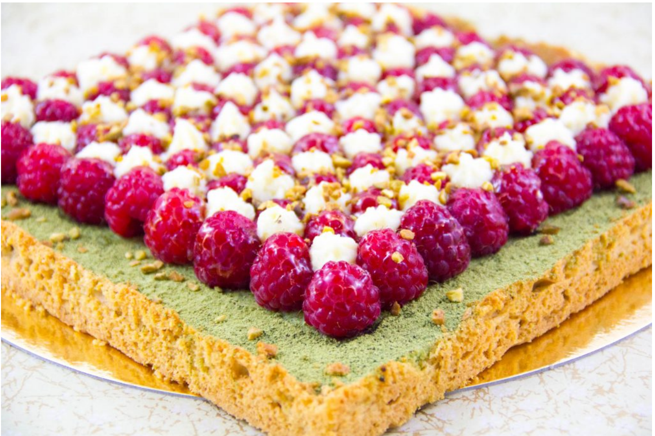
Tarte estivale framboise pistache et thé matcha