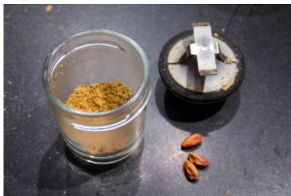
Mixez 30 g de pistaches