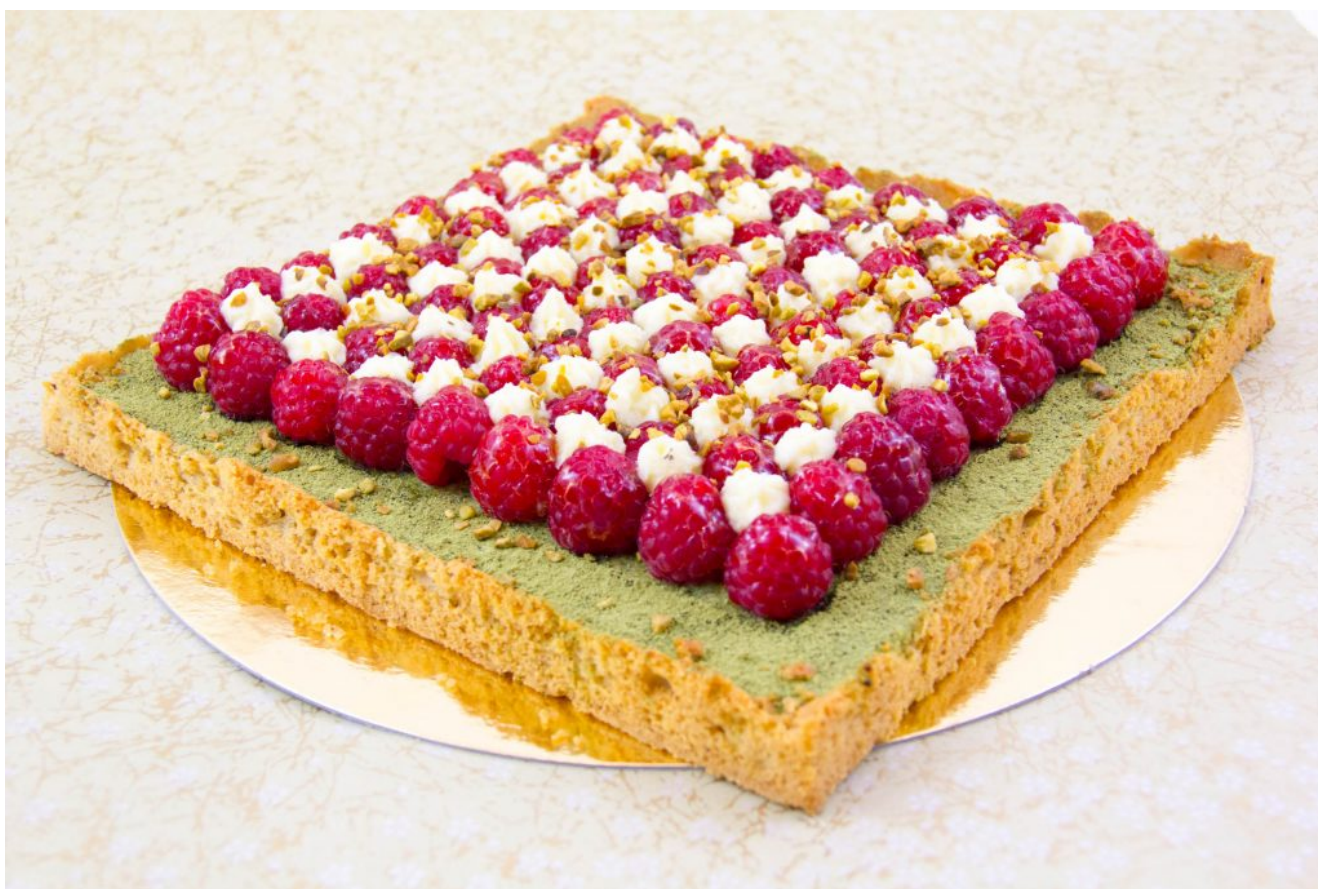
Tarte estivale framboise pistache et thé matcha