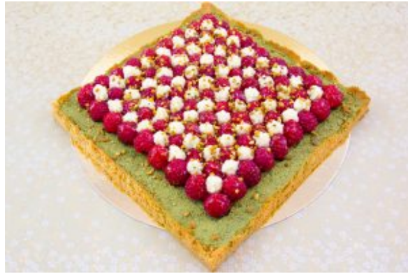
Tarte estivale framboise pistache et thé matcha