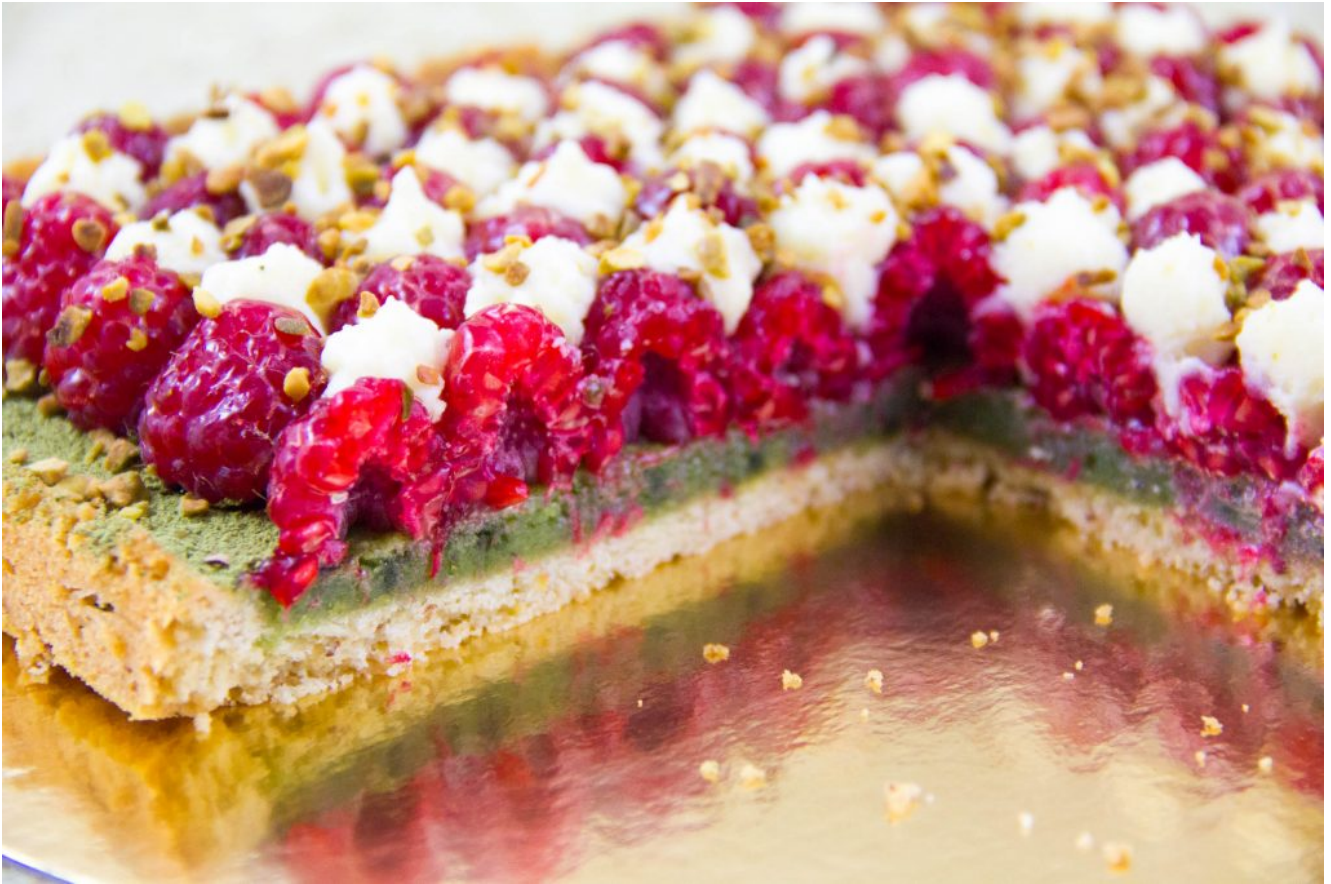
Tarte estivale framboise pistache et thé matcha