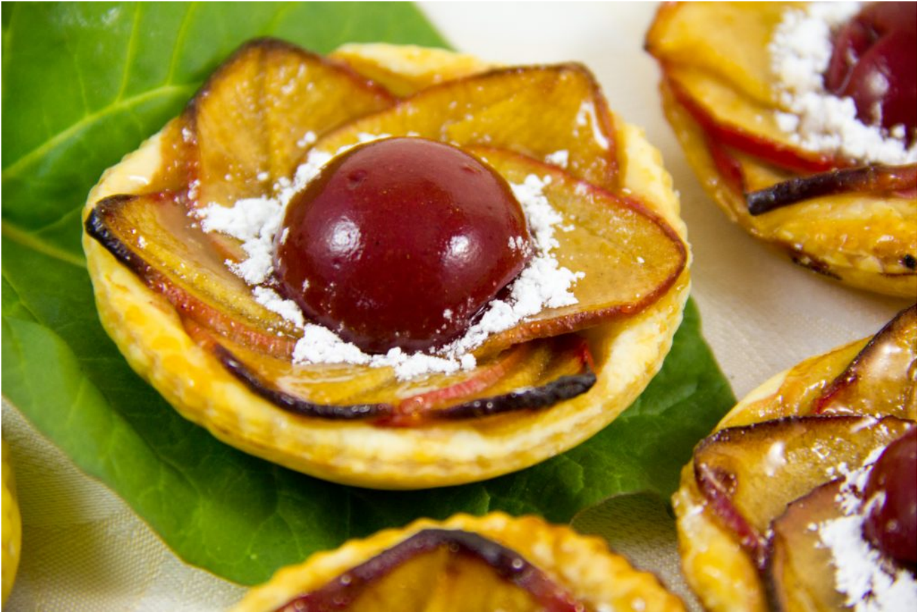
Tartelette « Fleur de pommier » au cœur rhubarbe et framboise