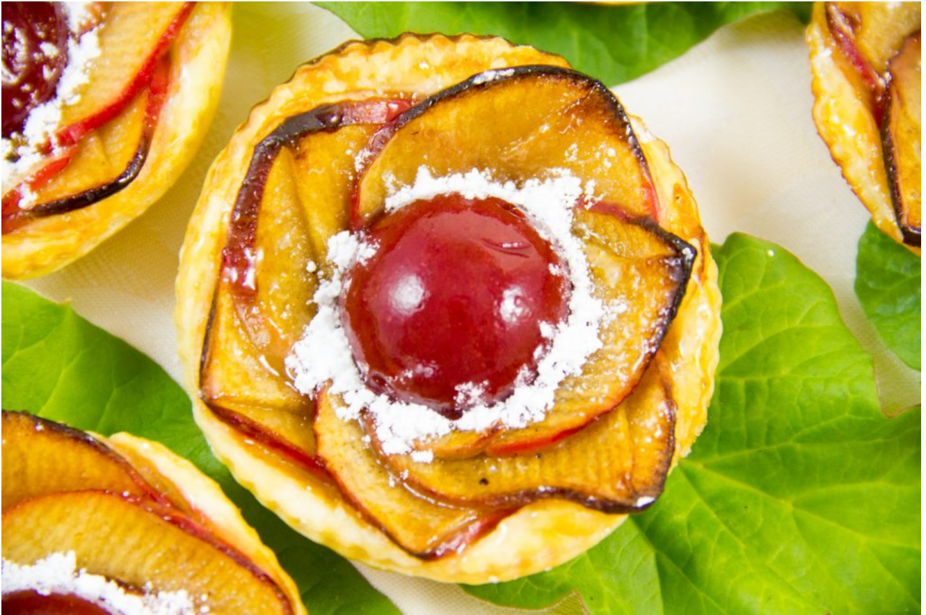
Tartelette « Fleur de pommier » au cœur rhubarbe et framboise