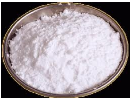
Sucre décor, sucre neige, Neige décor - La boutique des pâtisseries