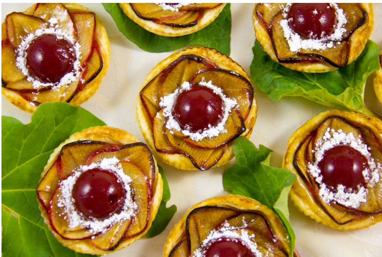
Tartelette « Fleur de pommier » au cœur rhubarbe et framboise

C'est la saison de la rhubarbe et j'ai eu envie de la marier à la pomme et la framboise en façonnant ces jolies tartelettes fleurs. Outre un visuel très floral, ces tartelettes sont une ode à la gourmandise. Vous me donnerez des nouvelles de ce beau dessert printanier!