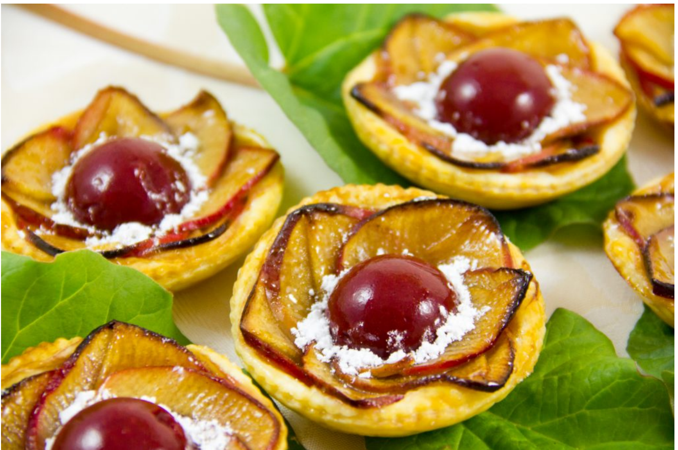
Tartelette « Fleur de pommier » au cœur rhubarbe et framboise