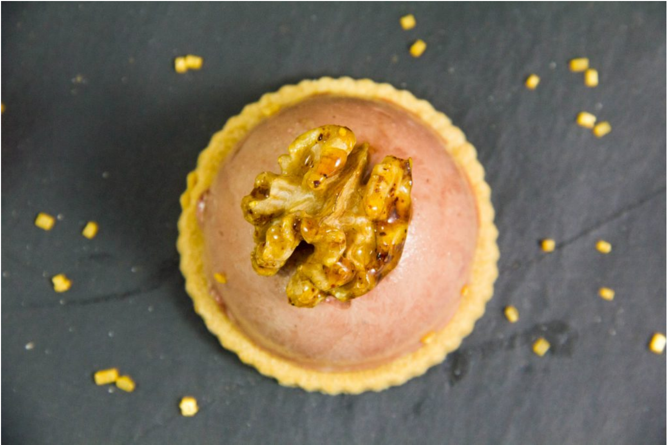
Élégantes tartelettes de foie de volaille, cœur mangue et oignon