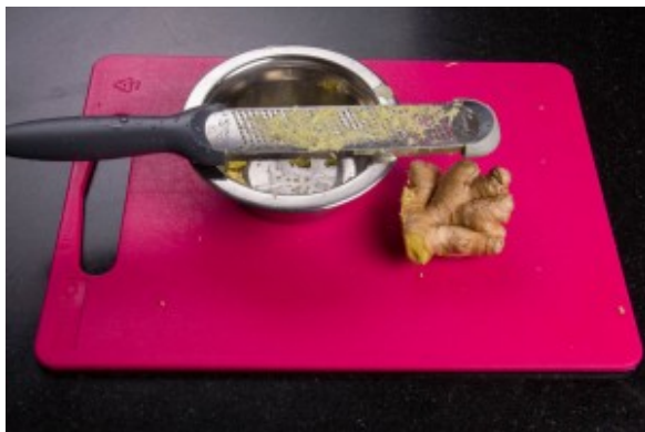
Râpez le gingembre