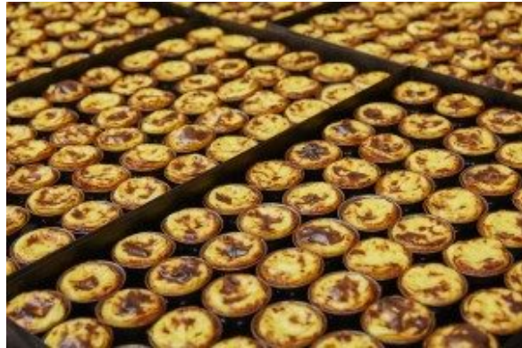
Pasteis de Belem

Lisboa Portugal . Pour une visite virtuelle de la célèbre boutique cliquez ici .