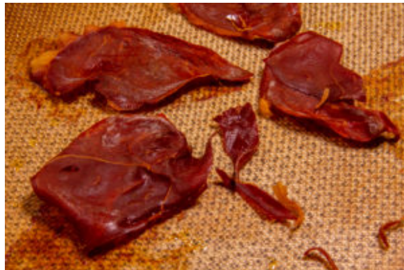
Tartinade au jambon