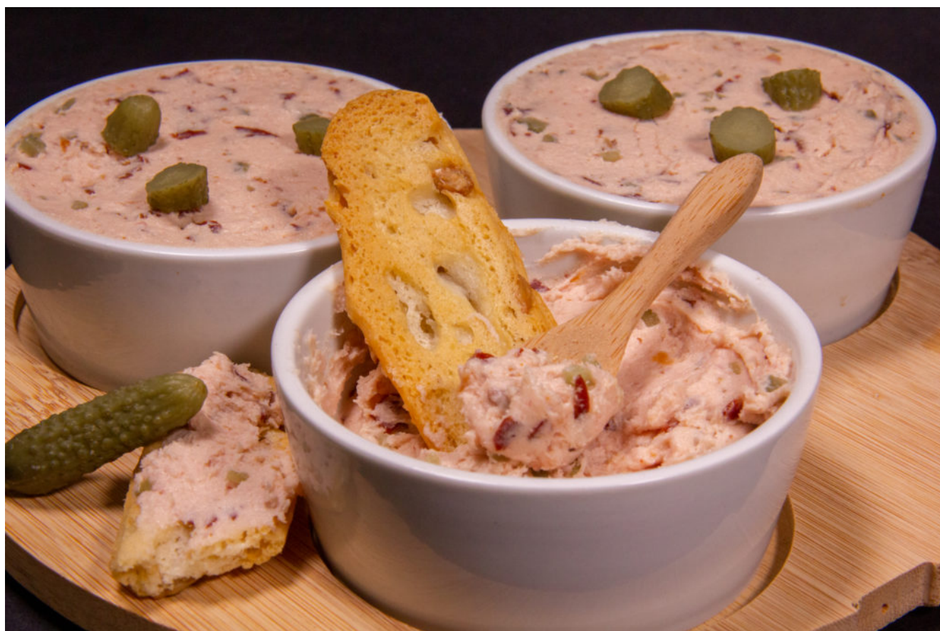
Tartinade au jambon

Intéressé(e) par une démonstration gratuite et gourmande du fameux Thermomix? Cliquez ici pour y assister!