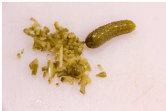
Tartinade au jambon