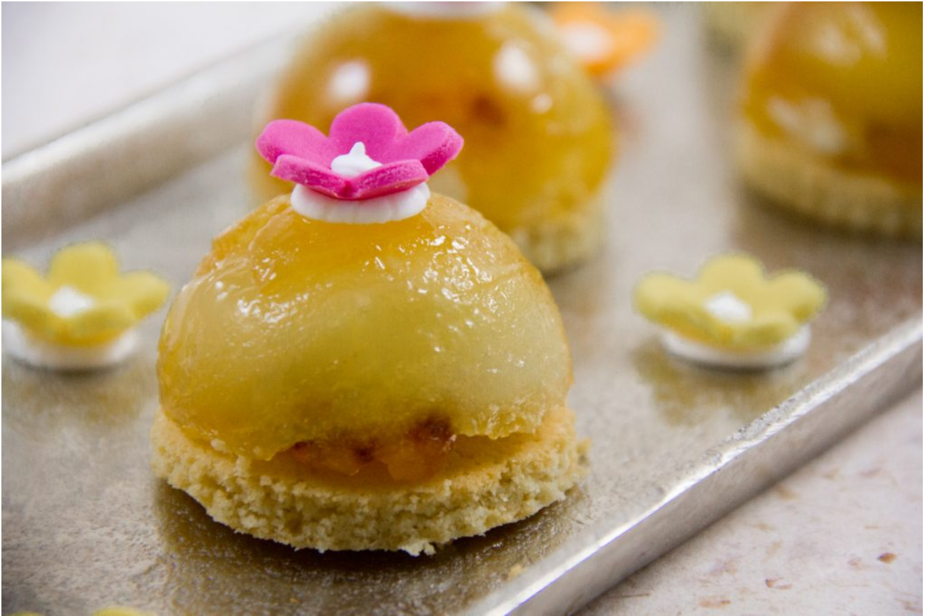
Mini tatin caramélisées au romarin