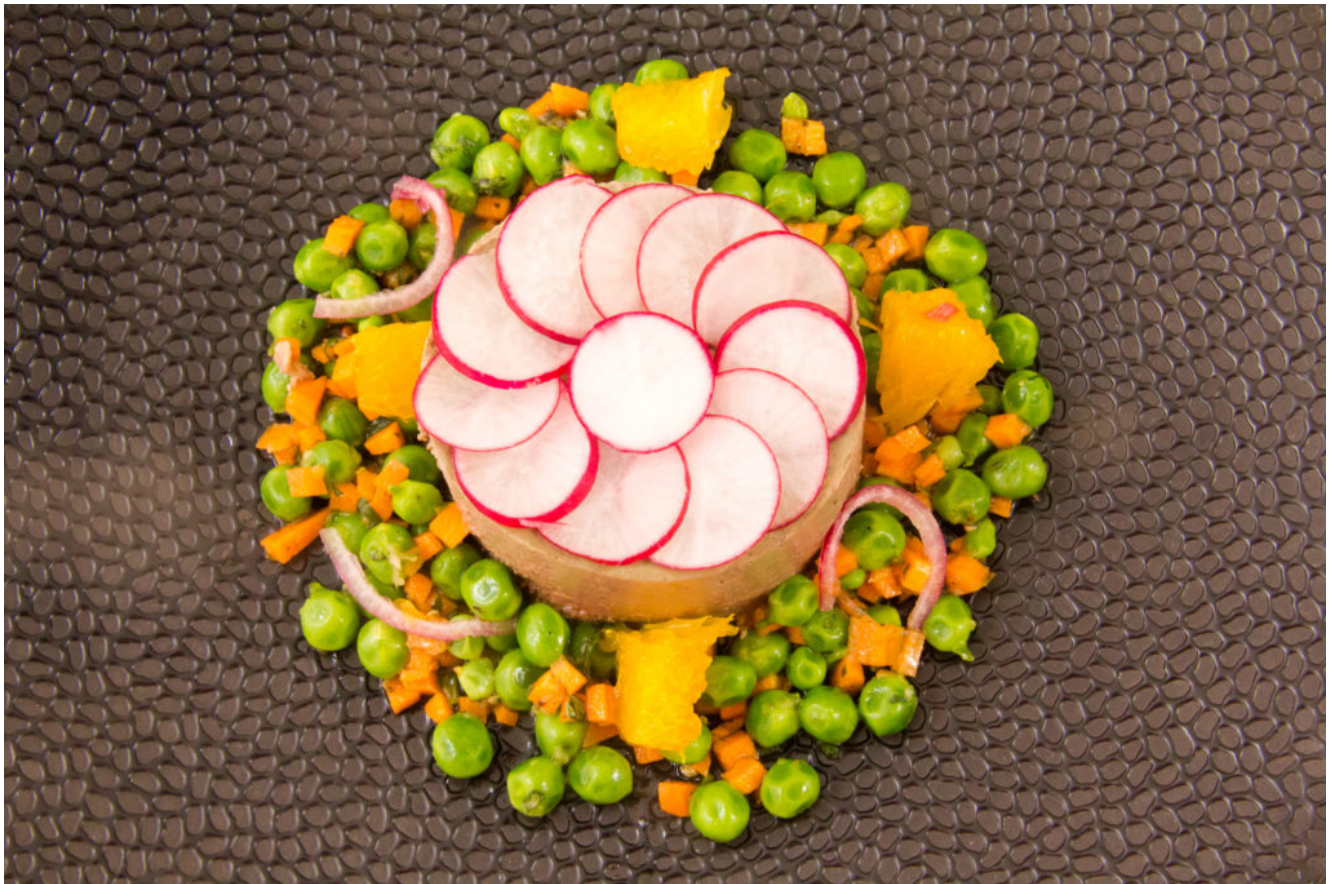
Mousse de foie de volaille basse température, salade de petits pois acidulée