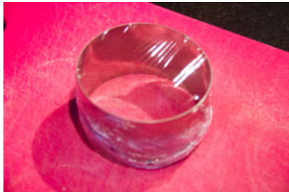
Filmez le dessous de vos cercles