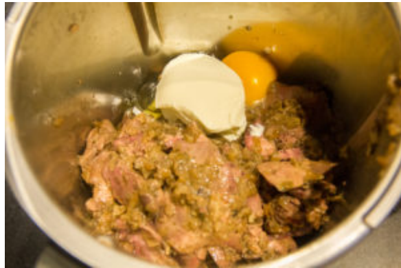
Terrine de foie de volaille BT