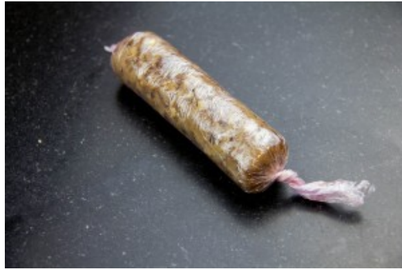
Former un petit boudin