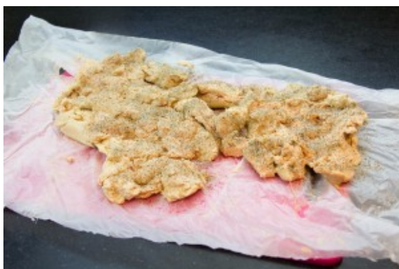
Assaisonnez les deux côtés du foie