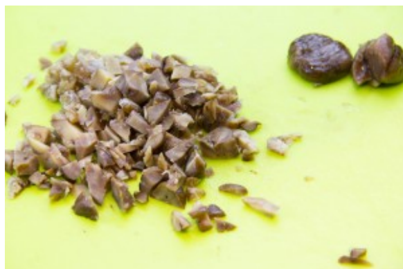
Détaillez vos marrons en