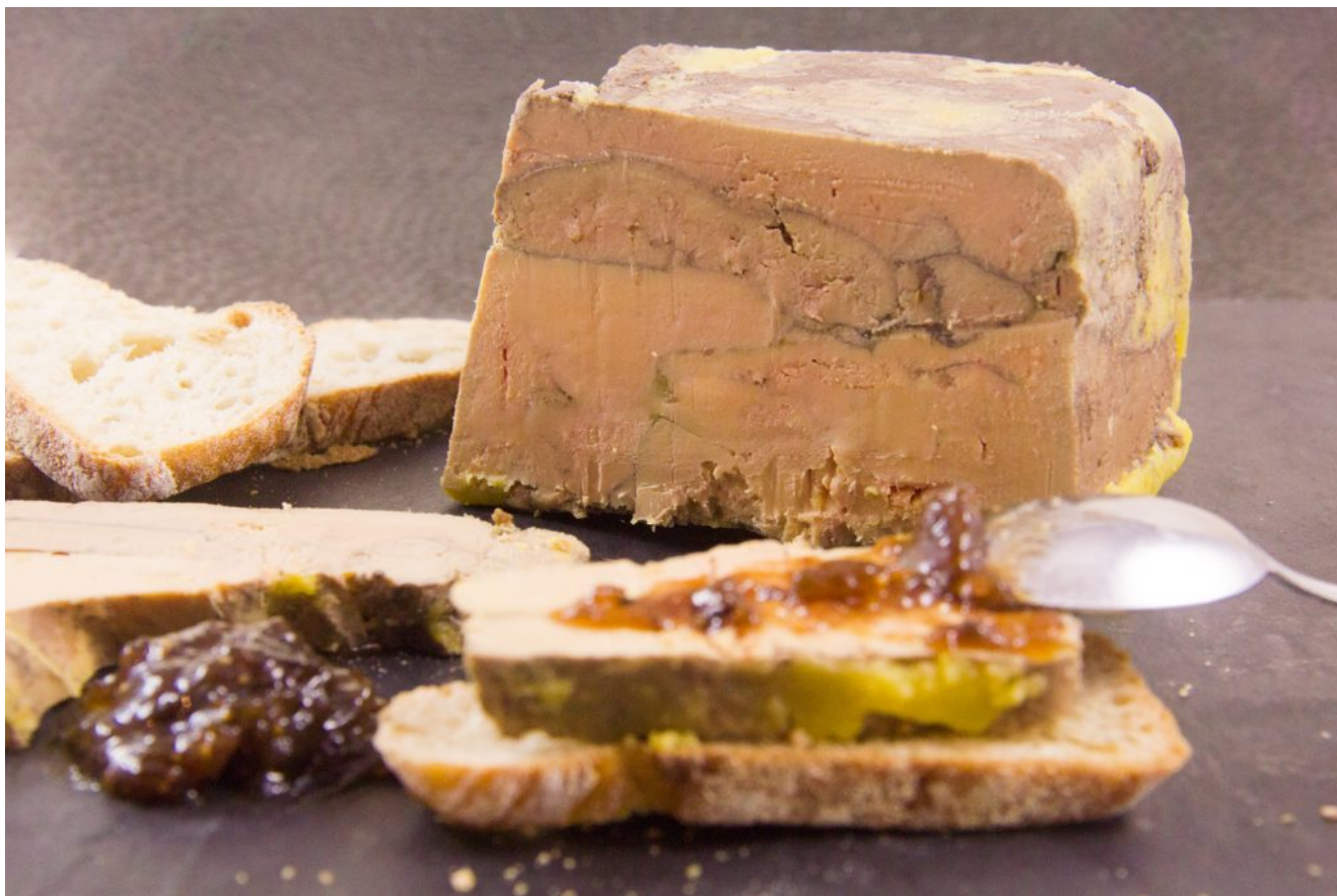
Foie gras au vin rouge et épices fruitées

Vous y retrouverez mes recettes phares en pas à pas imagées comme dans le blog.