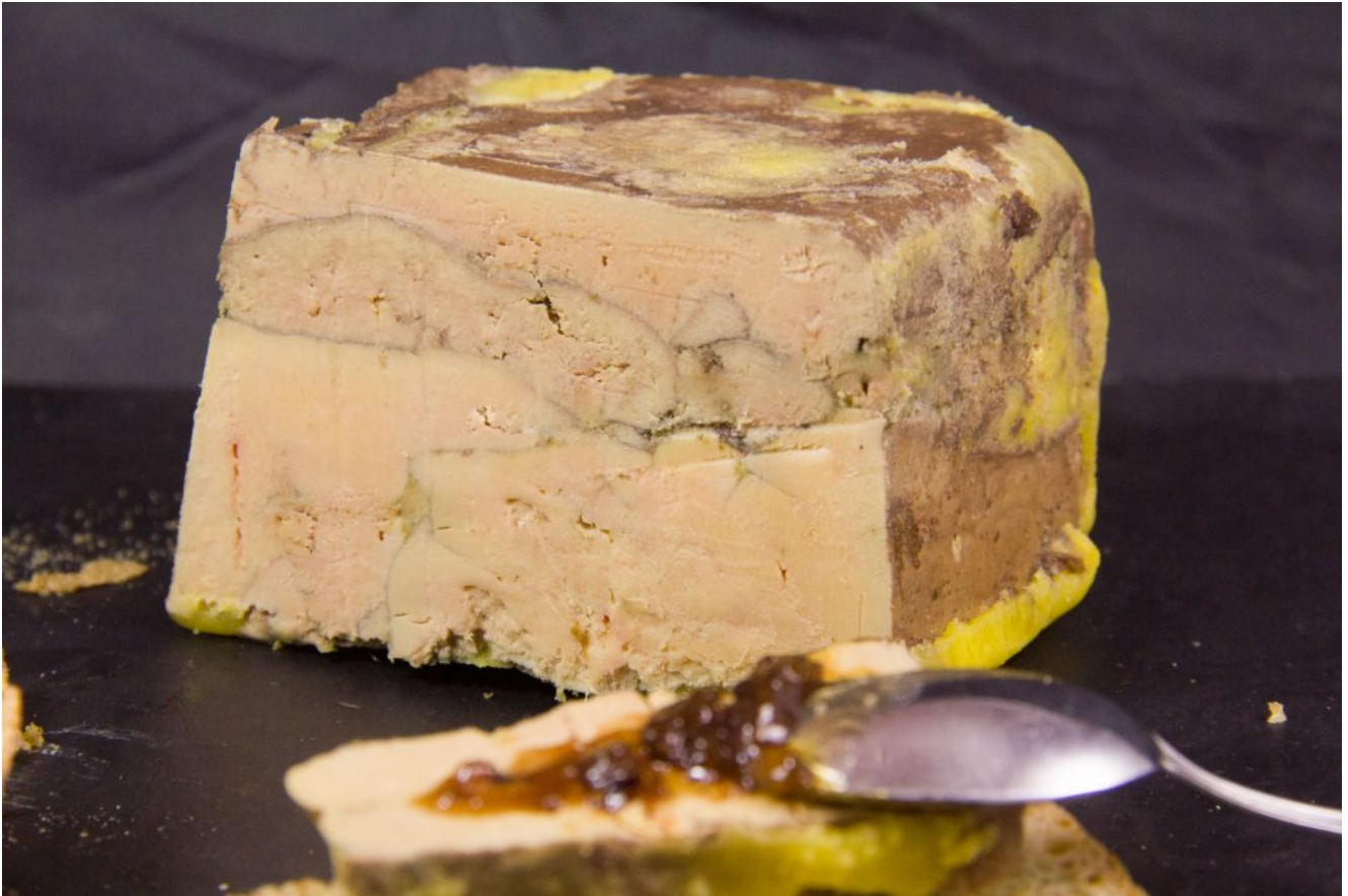
Foie gras au vin rouge et épices fruitées