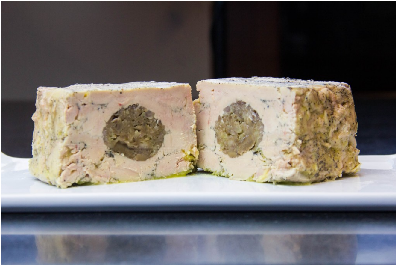
Terrine de foie gras maison aux marrons et au cognac