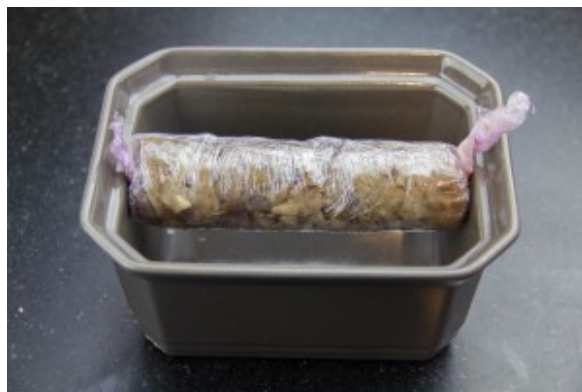
Le boudin doit avoir la longueur de la terrine

Maintenant on passe à la préparation du foie gras.