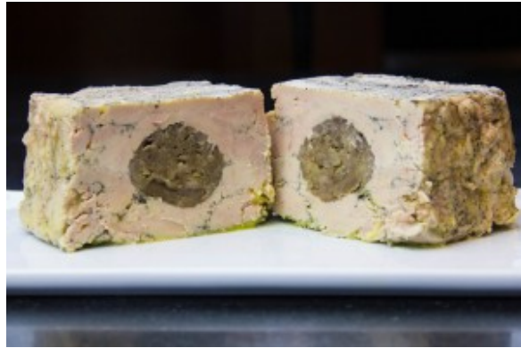
Terrine de foie gras maison aux marrons et cognac

Ce foie se conserve quelques jours au frais mais vous pouvez le conserver un bon mois en le mettant sous vide.