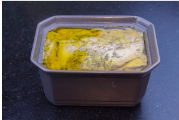
A la sortie du four