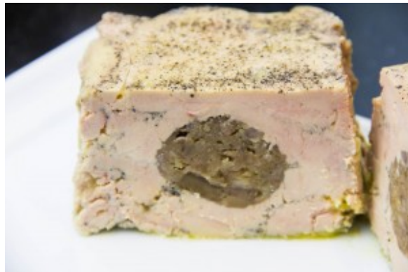
Terrine de foie gras maison aux marrons et au cognac