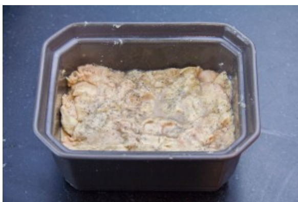
Remplissez la terrine en plaçant les beaux morceaux