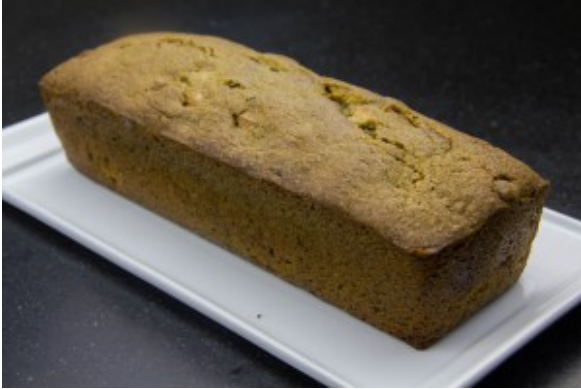
Cake au thé matcha et chocolat blanc