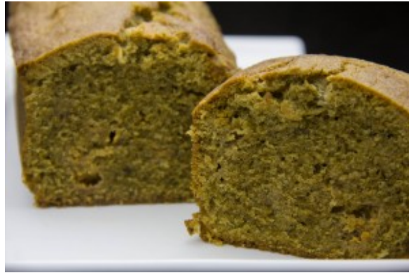
Cake au thé matcha et chocolat blanc