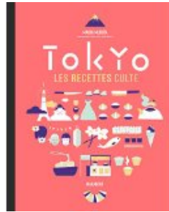
Tokyo les recettes cultes

Cette recette provient du livre « Tokyo, les recettes cultes » de Maori Murota chez Marabout que je vous recommande si vous aimez la cuisine japonaise! Vous y trouverez plein de recettes familiales japonaises faciles à faire qui changent des habituels shushis, sashimis qui ne sont qu'une vision réductrice (mais néanmoins délicieux quand ils sont bien faits) de cette excellente cuisine asiatique mal connue.