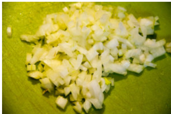
Épluchez et détaillez les oignons en fine brunoise