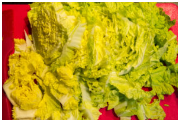
Ciselez les feuilles du chou chinois