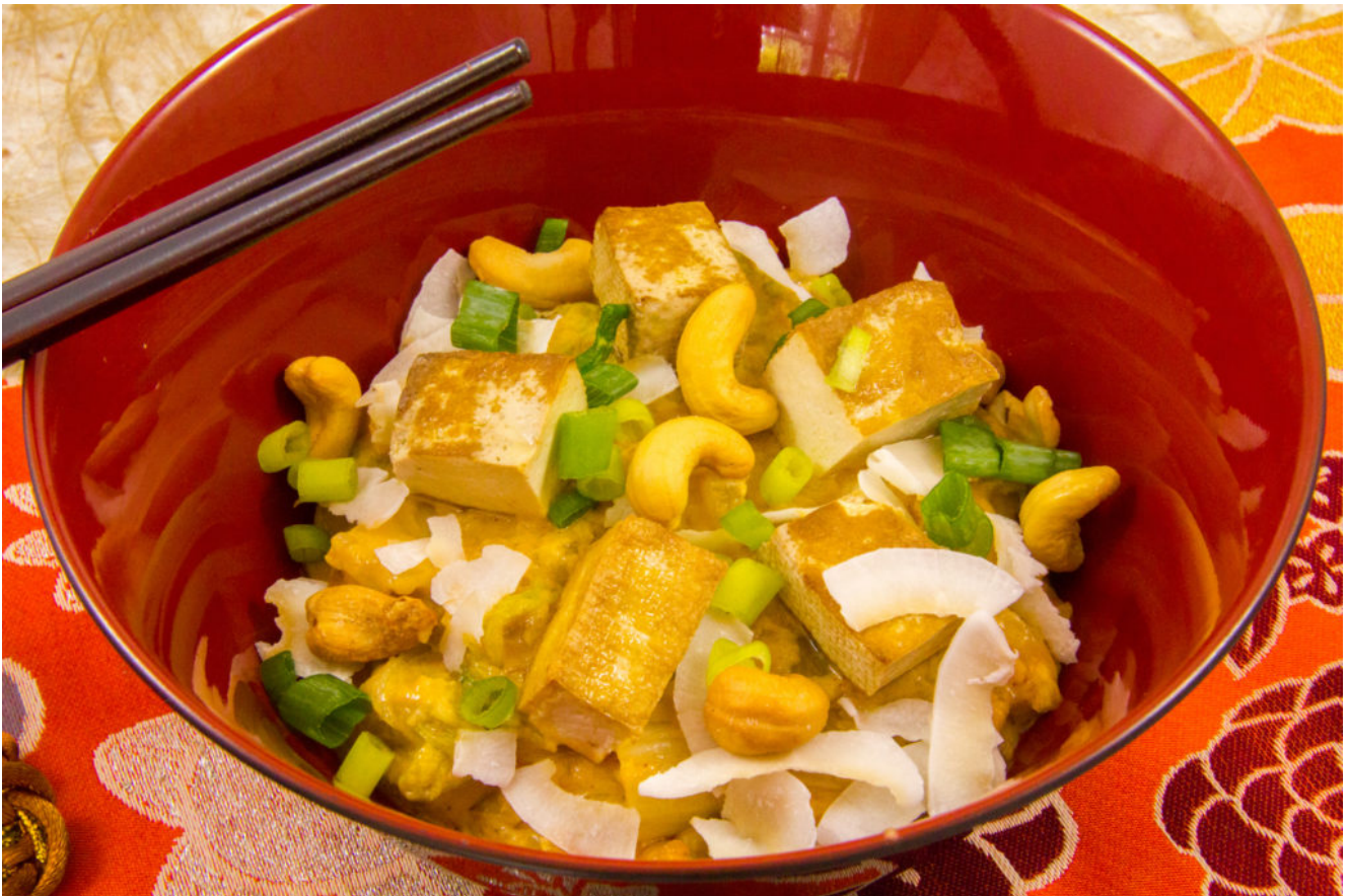
Compoté de chou chinois au curry rouge, tofu fumé