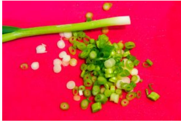
Ciselez les cébettes