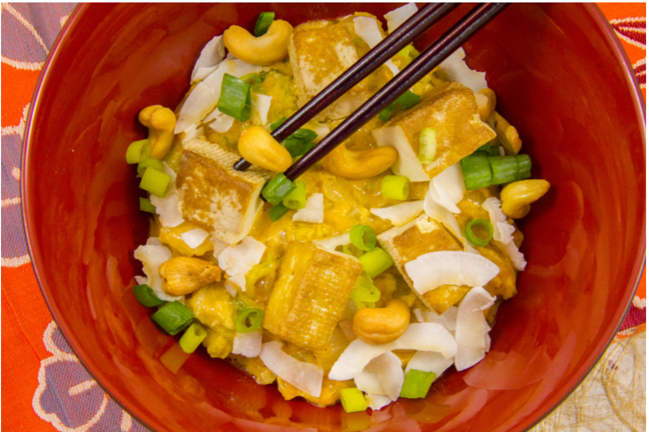
Compoté de chou chinois au curry rouge, tofu fumé

Les currys, qu'ils soient indiens ou thaïlandais, sont toujours des plats très goûteux. Voici une petite merveille végétale, la Compoté de chou chinois au curry rouge, tofu fumé qui va vous régaler!