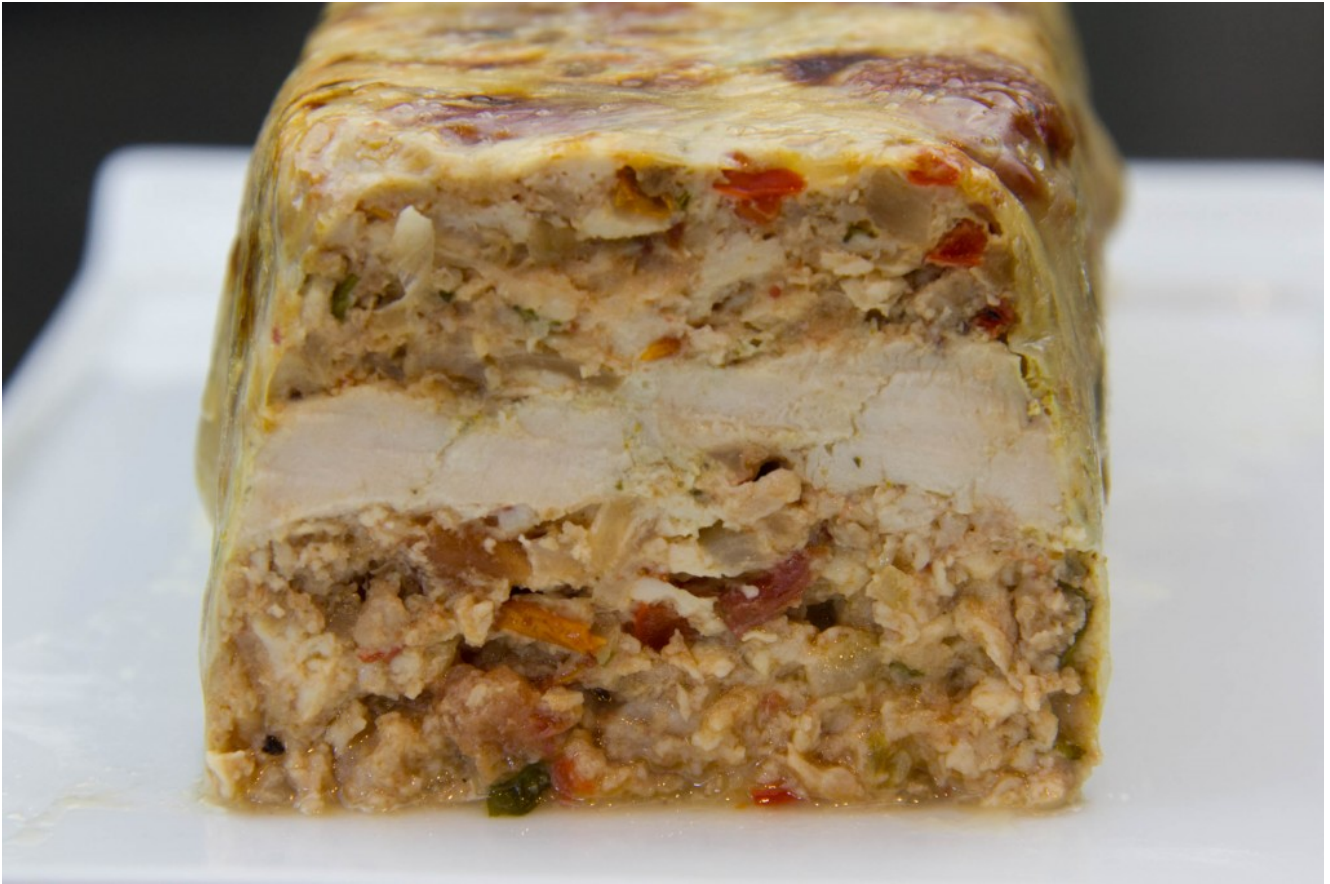
Terrine de poulet à l'estragon et tomates séchées