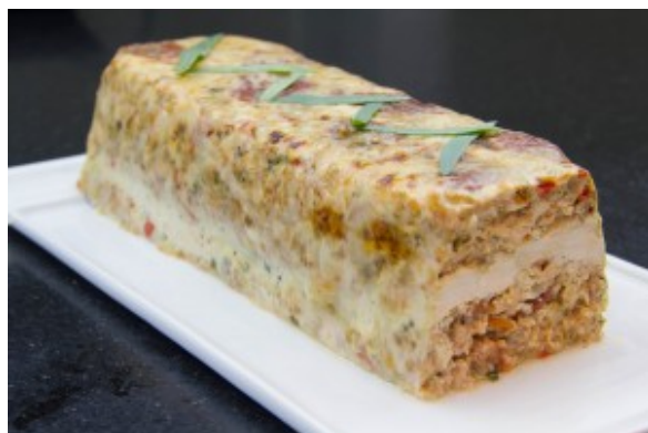
Terrine de poulet à l'estragon et tomates séchées