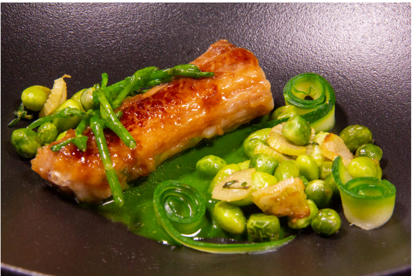
Roussette au vert