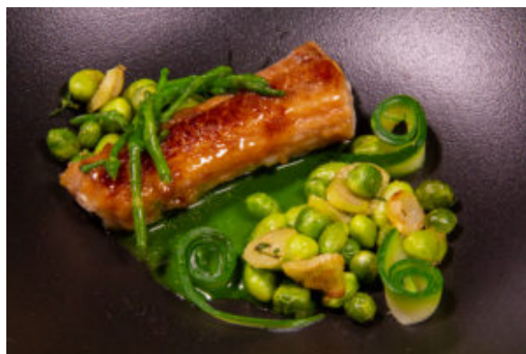
Roussette au vert