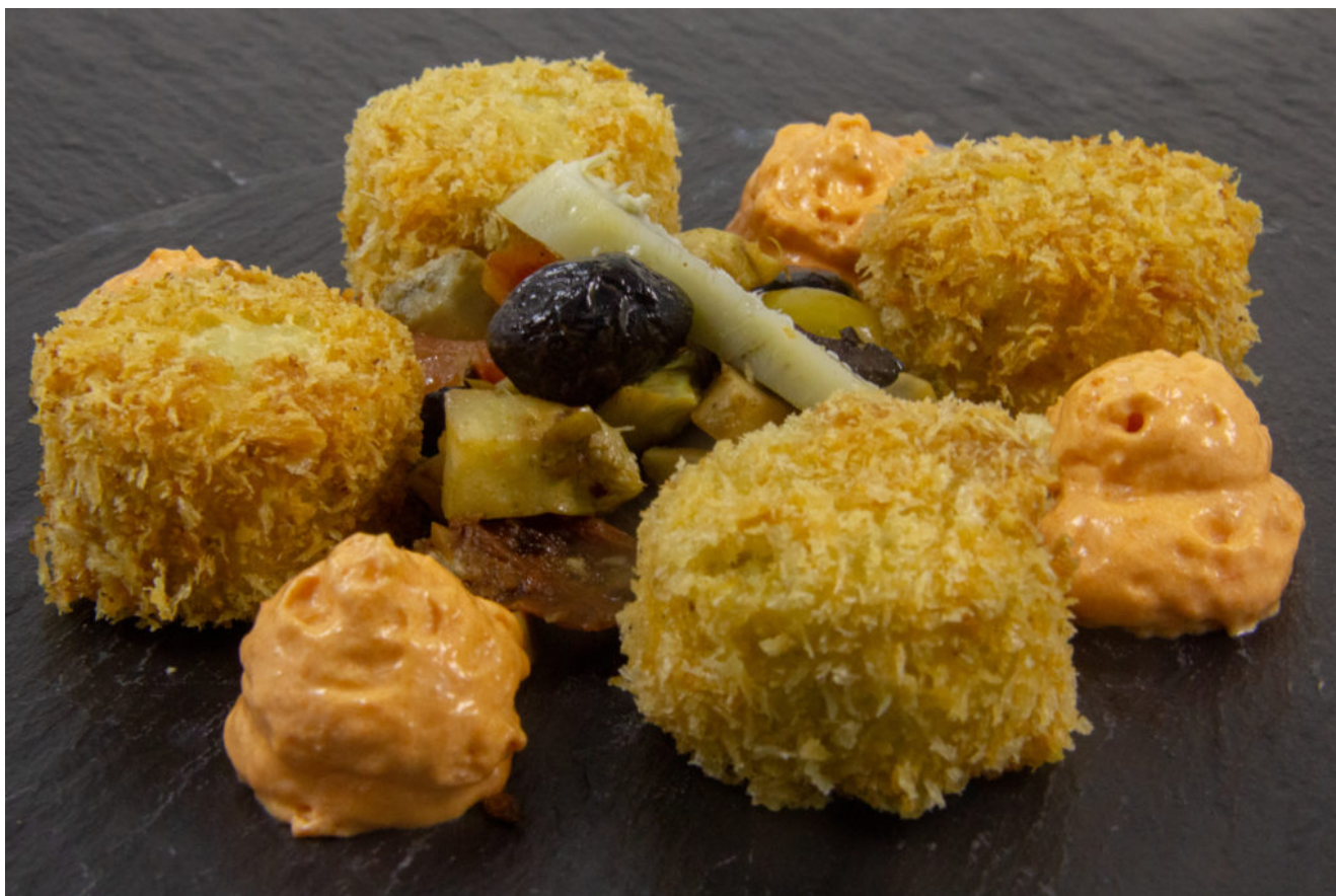
Tout artichaut (cromesquis et barigoule, espuma au poivron)

Les artichauts sont préparés en cuisson sous vide basse température pour obtenir encore plus de saveurs mais vous pouvez les préparer également à la vapeur si vous n'êtes pas équipé pour la cuisson sous vide.