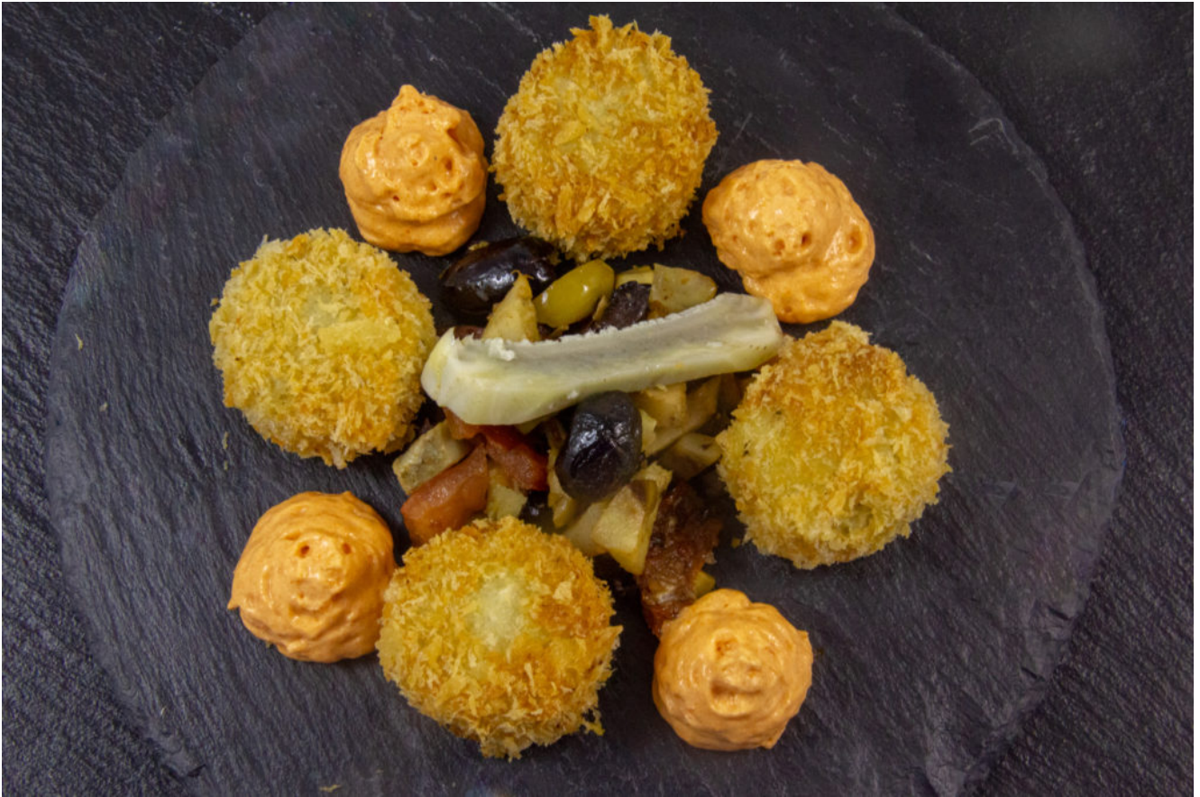
Tout artichaut (cromesquis et barigoule, espuma au poivron)