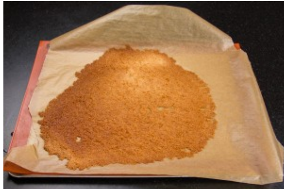
La bonne coloration

cassez la alors en gros morceaux que vous placerez dans une boîte hermétique.