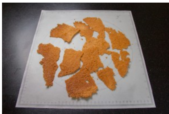
De beaux morceaux irréguliers