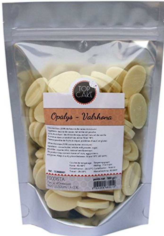
Top cake - Chocolat Valrhona Opalys 500g