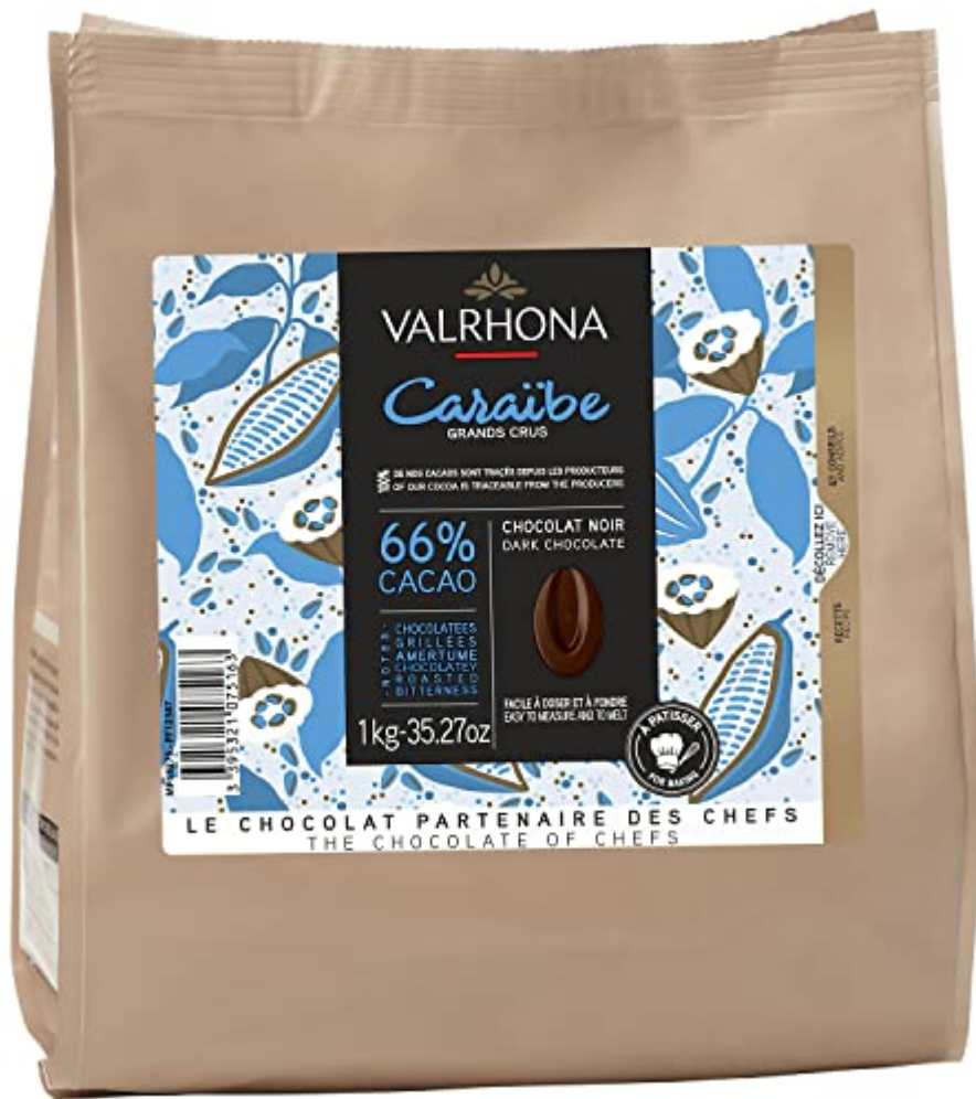
Sac de fèves Caraïbe 66 % Valrhona