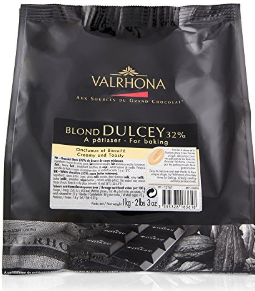
Valrhona - Fèves de chocolat Blond Dulcey 32% - A Pâtisser - 1Kg