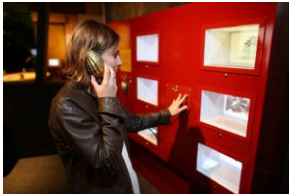
Parcours découverte Chocolat Valrhona