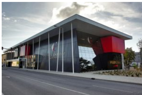
La cité du Chocolat Valrhona

Si vous habitez la région où si vous êtes de passage ne manquez de visiter cet endroit unique en son genre, véritable escale gourmande!