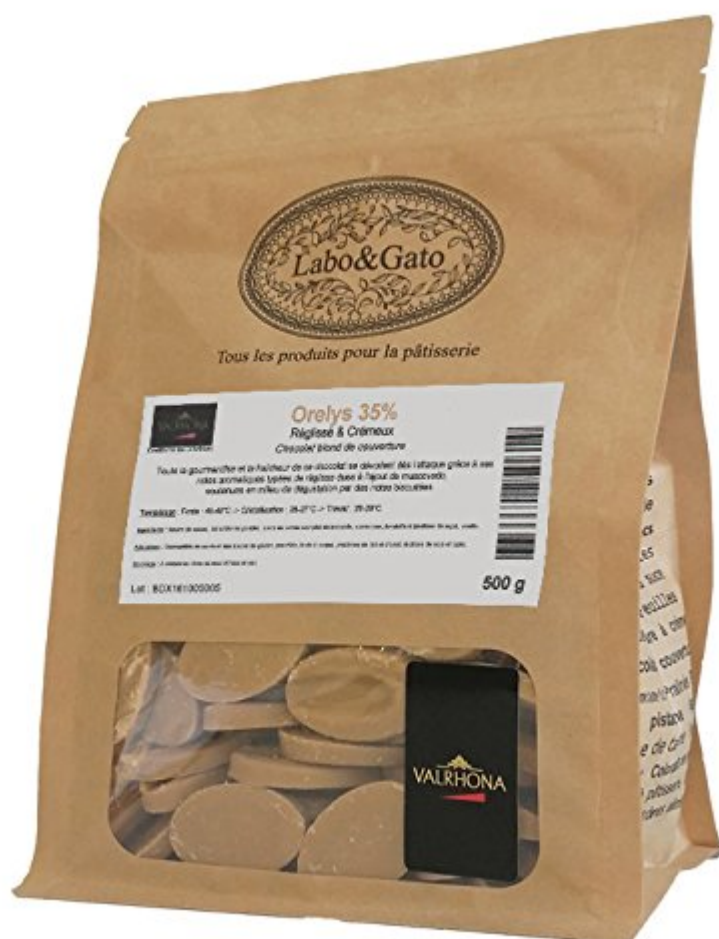
Valrhona - Orellys 35% chocolat blond au muscovado de couverture fèves 500 g