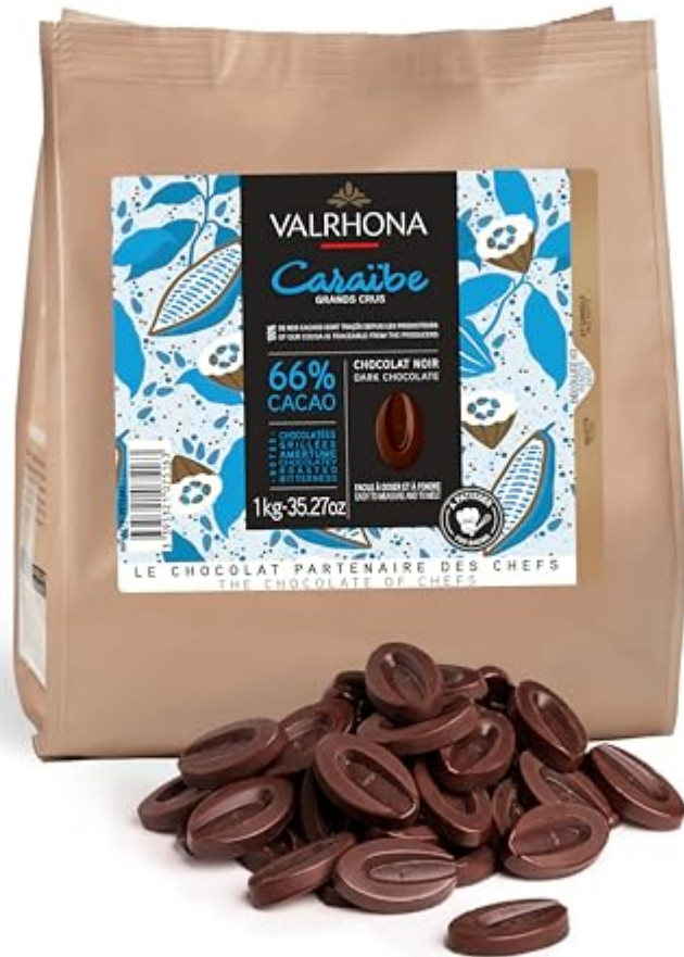
Sac de fèves Caraïbe 66 % Valrhona