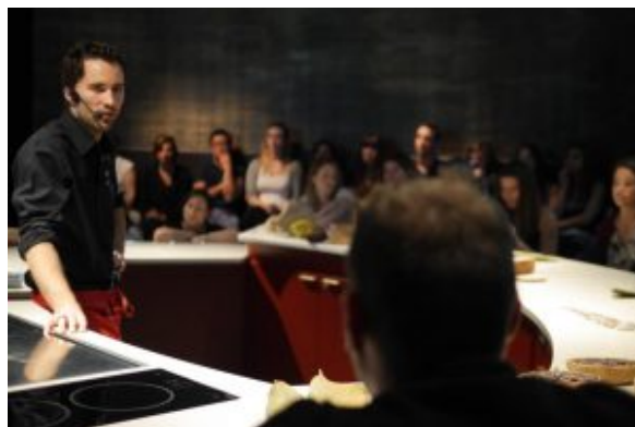
Atelier Découverte Chocolat Valrhona