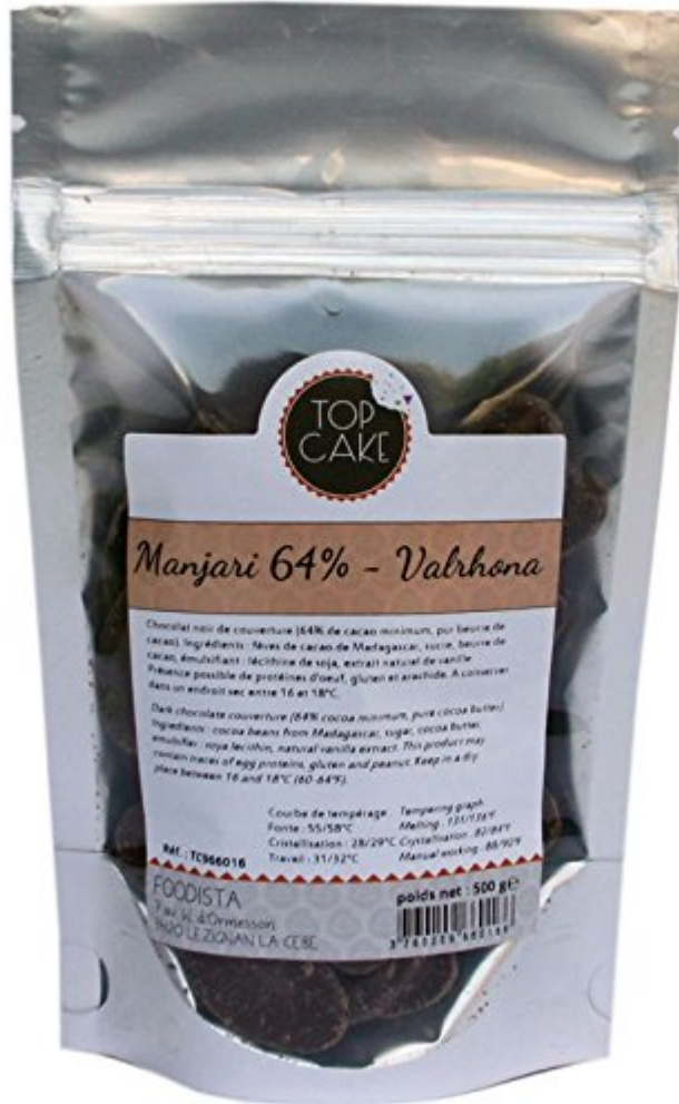
Top cake - Fèves chocolat noir Valrhona Manjari 64% 500g