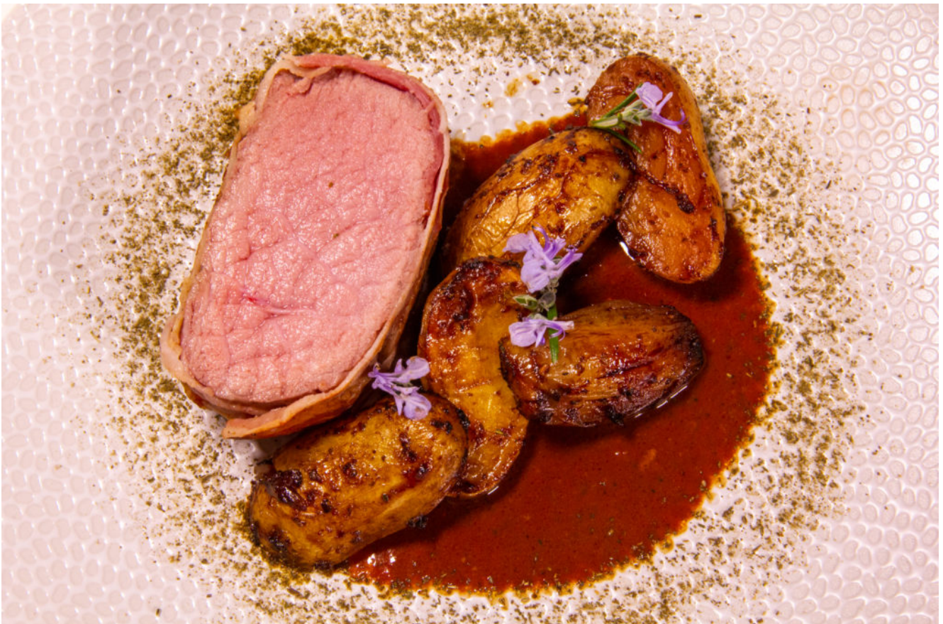
Veau au romarin (Recette basse température)