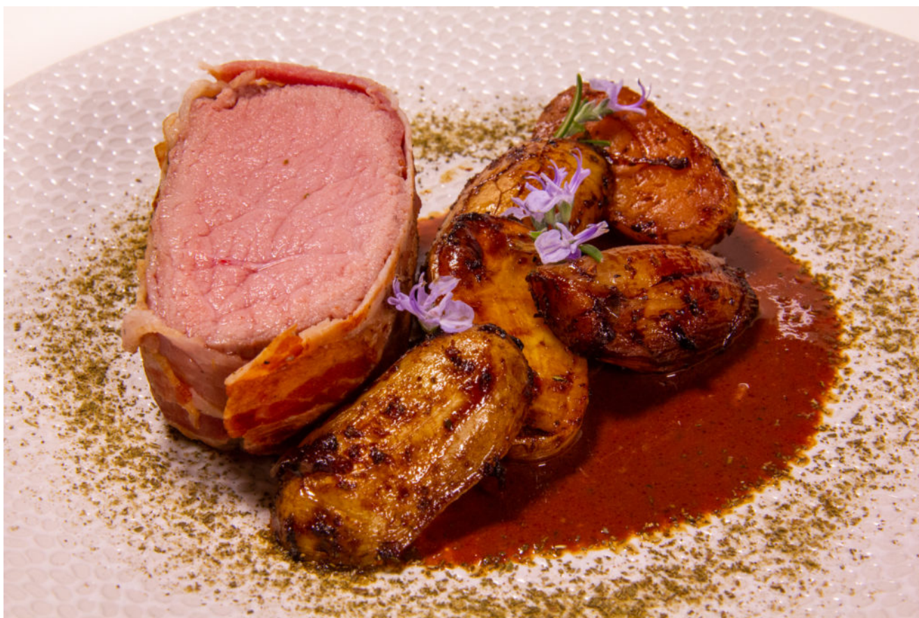
Veau au romarin (Recette basse température)

Beaucoup d'entre vous aviez émis le souhait d'être informés de la parution de mes meilleures recettes basse température.