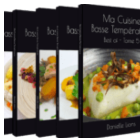
Tomes 1, 2, 3, 4, 5

Beaucoup d'entre vous aviez émis le souhait d'être informés de la parution de mes meilleures recettes basse température.