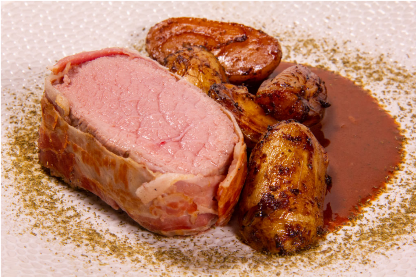
Veau au romarin (Recette basse température)