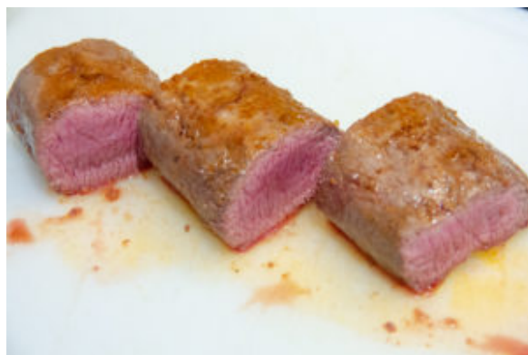
Coupez chaque filet d'agneau en morceaux