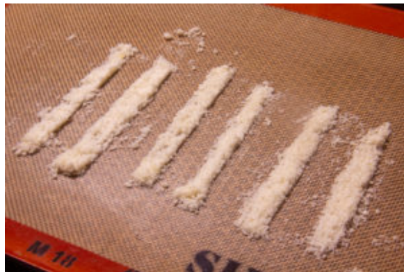
Tuiles au parmesan