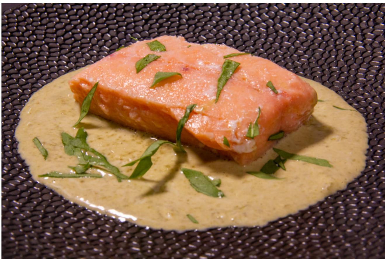
Saumon à l'oseille (recette Thermomix)