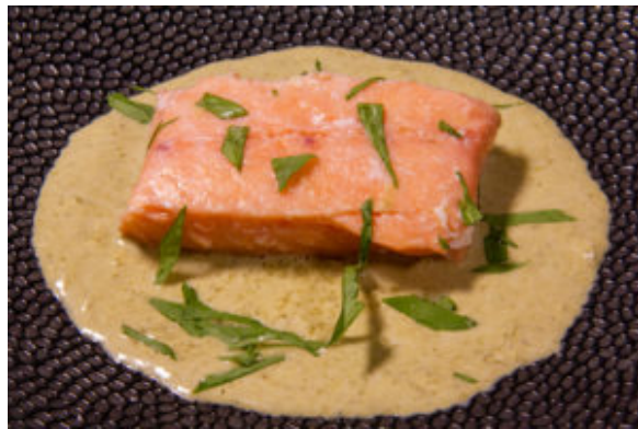
Saumon à l'oseille (recette Thermomix)