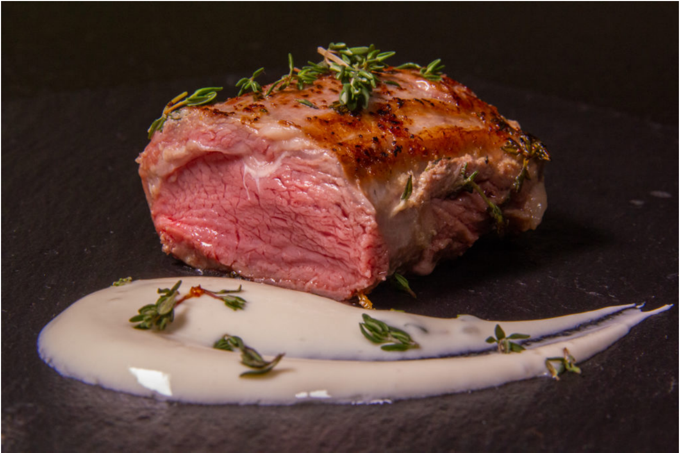
Agneau et sa crème d'ail (Recette TM6, cuisson sous vide)u