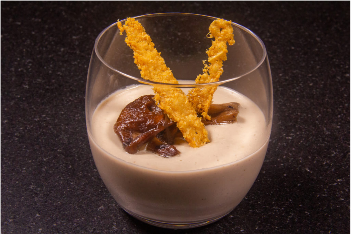
Cappuccino de champignons (recette Thermomix)

Vous désirez concocter d'autres recettes gourmandes au Thermomix? Mon dernier livre « Mes recettes gourmandes au Thermomix » vient de paraître. J'ai voulu avec ce livre, vous proposer un recueil de mes meilleures recettes au Thermomix et en particulier des « plats all in one » sains et goûteux, réalisable en 30 à 40 mn, pour la plupart sans autre mode de cuisson que votre Thermomix et surtout sans avoir le nez dans vos casseroles! Ce livre permet de réaliser sans stress 100 recettes gourmandes dont 40 plats ou menus all in one.