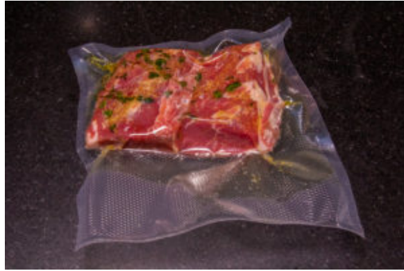
Agneau et sa crème d'ail (Recette TM6, cuisson sous vide)u

58° en n'oubliant pas d'insérer auparavant le disque cuisson spécial pour la cuisson basse température ( à commander en cliquant ici – pour la zone Benelux-) et en remplissant le bol d'eau (la sachet de viande doit être complètement immergé).