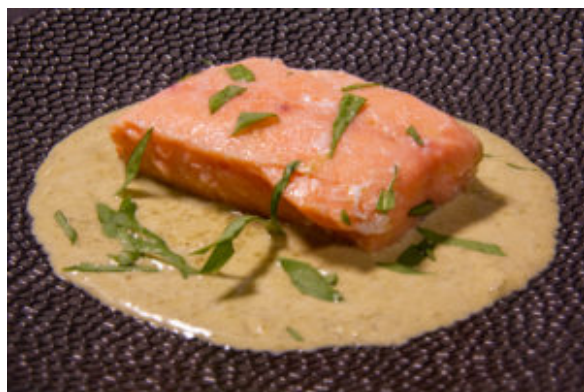
Saumon à l'oseille (recette Thermomix)