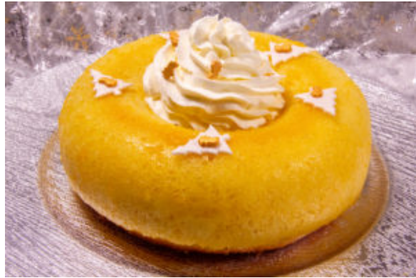
Baba de Pâques (recette Thermomix)