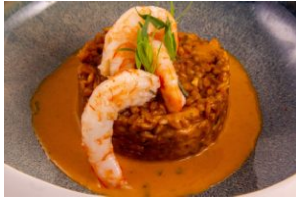
risotto d'épautre aux crevettes (Thermo)

Et quelques recettes personnelles réalisées grâce à ce petit génie de la cuisine: