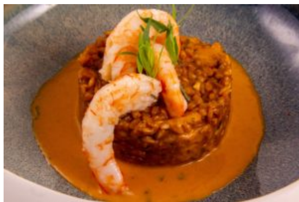
risotto d'épautre aux crevettes (Thermo)

Et quelques recettes personnelles réalisées grâce à ce petit génie de la cuisine: