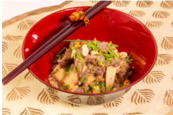
Boeuf aux cacahuètes (recette Thermomix)