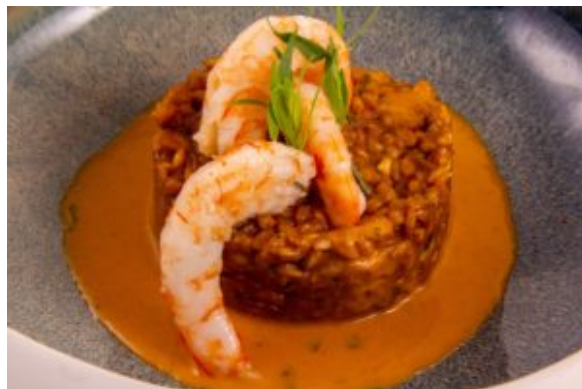
risotto d'épautre aux crevettes (Thermo)

Et quelques recettes personnelles réalisées grâce à ce petit génie de la cuisine: