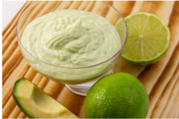
Mayonnaise à l'avocat (recette sauce Thermomix)