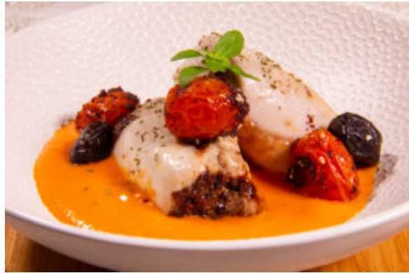
Poulet provençal (recette Thermomix)