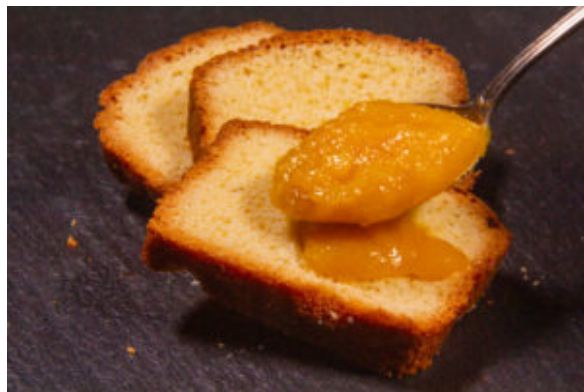
Crème d'abricot romarin (recette Thermomix)