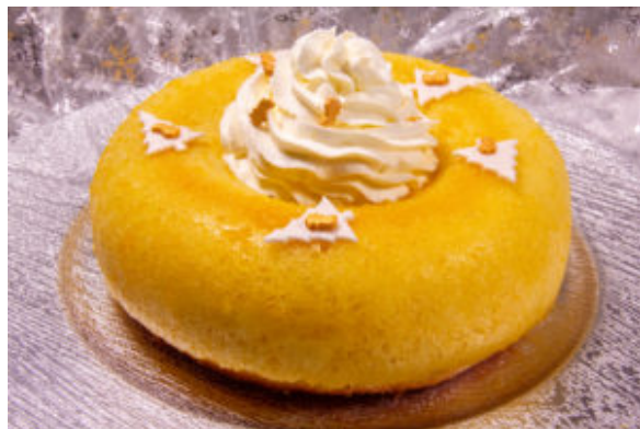
Baba de Pâques (recette Thermomix)