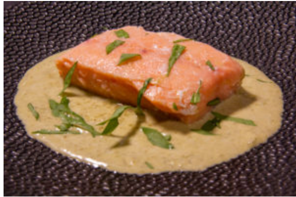
Saumon à l'oseille (recette Thermomix)