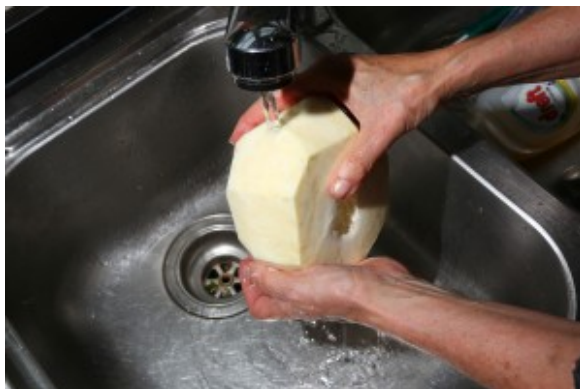
Rincez le céleri rave