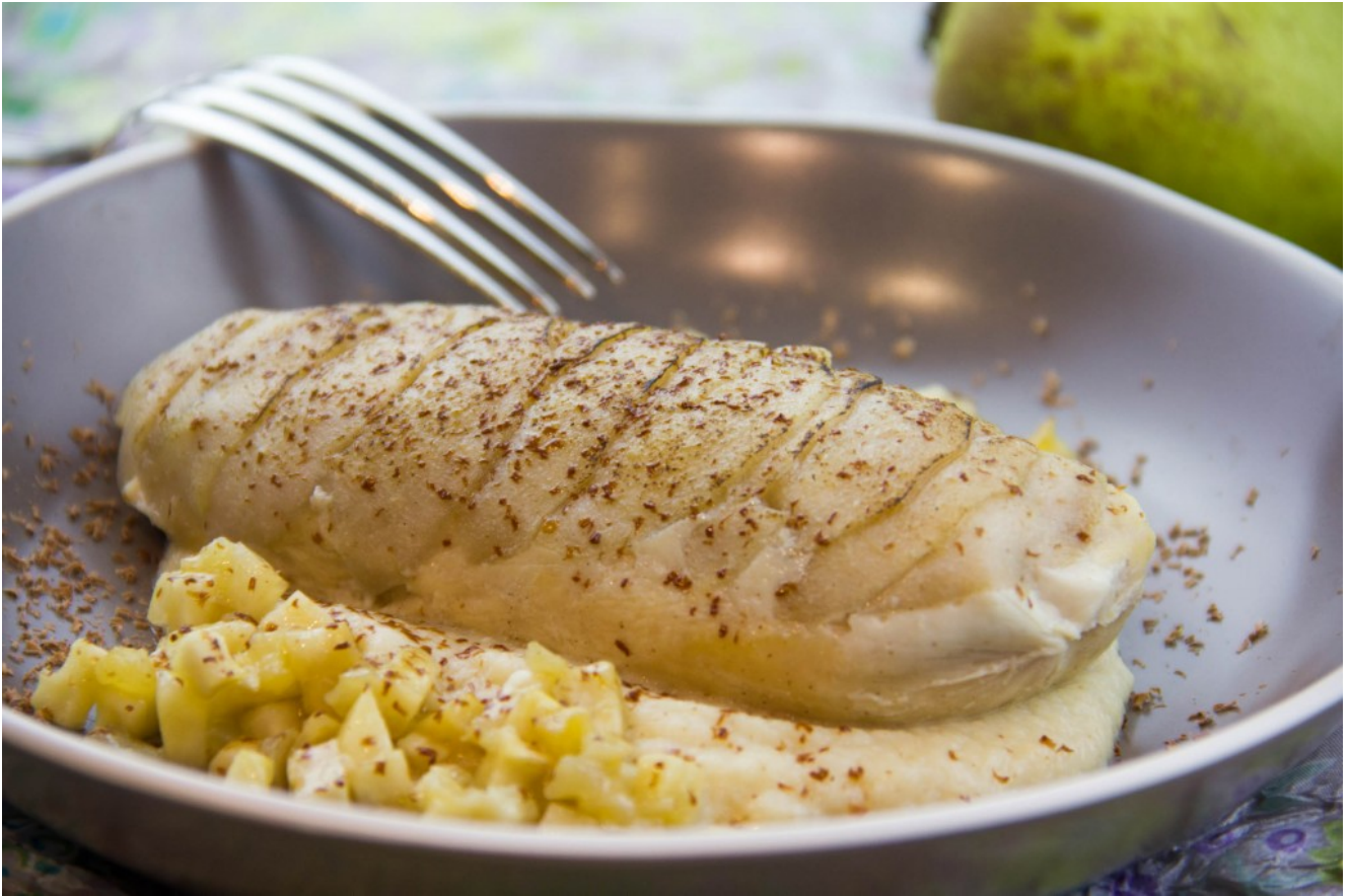
Suprêmes de volaille en écailles de poire, purée de céleri de Philippe Etchebest