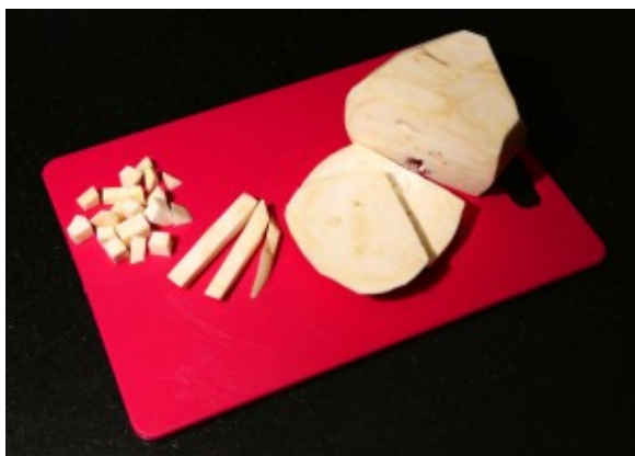
Coupez-le en tranches puis en petits dés