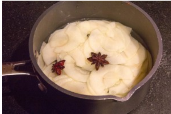
Infusez les poires