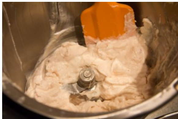
Mixez le blanc de poulet