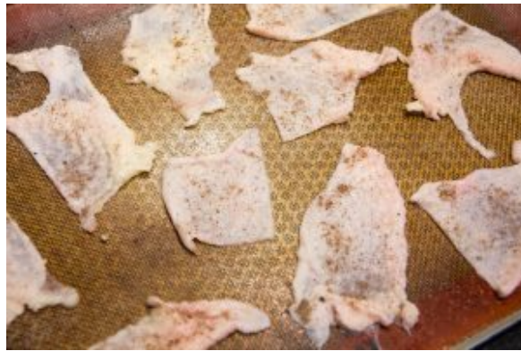
Cuire la peau des blancs de poulet