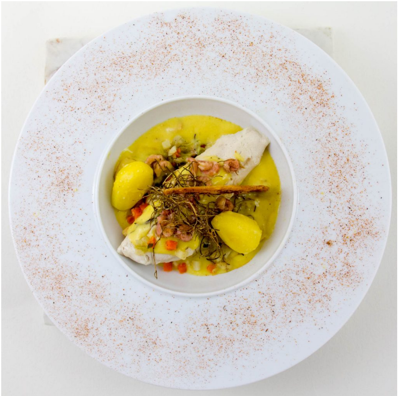
Mon Waterzooi terre mer basse température