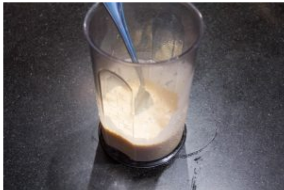
Mélangez la crème et les jaunes d'œuf.