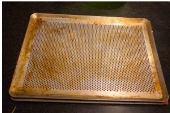
Placez une plaque par dessus pour éviter que les peaux se recroquevillent à la cuisson