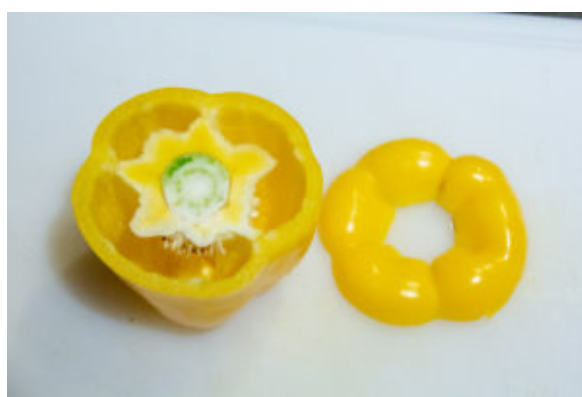
Coupez le dessus du poivron