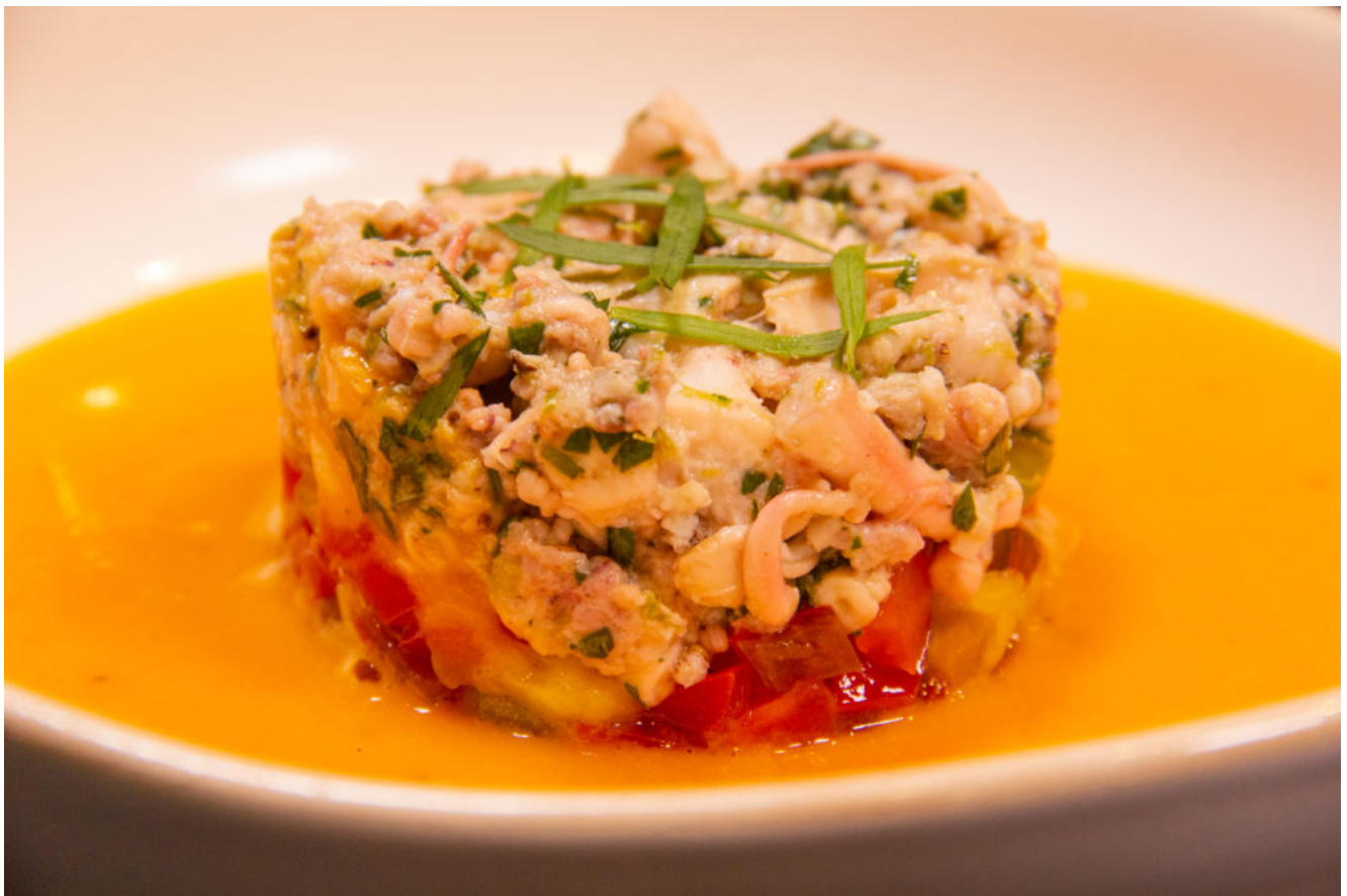
Tartare de poulpe et sa nage de poivron