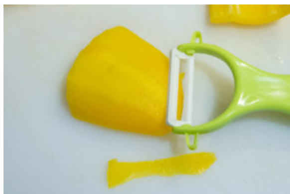
Pelez le poivron