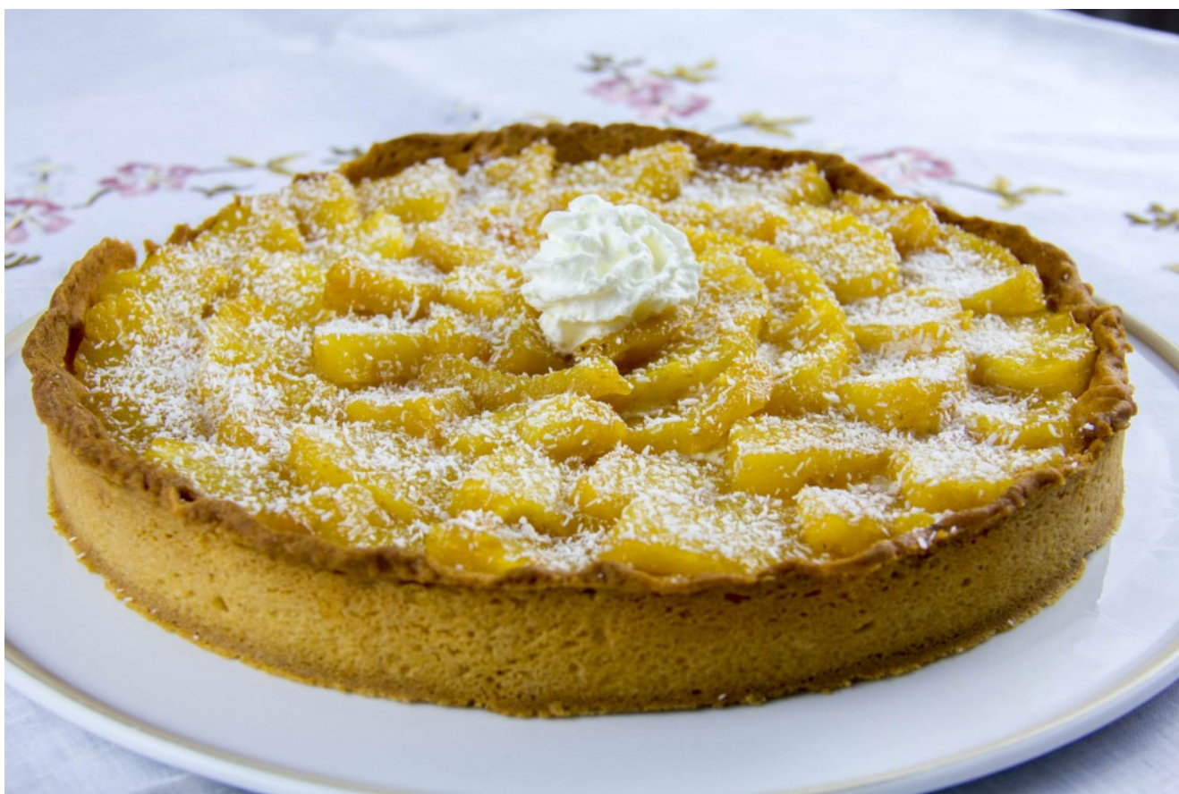
Tarte à l'ananas caramélisée