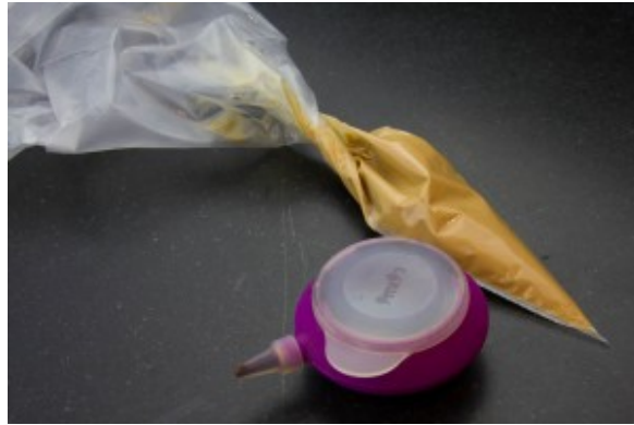
Petites poches à douille différentes