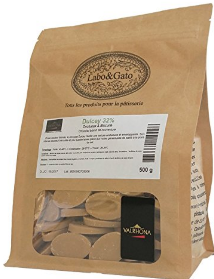
Valrhona - Dulcey 32% chocolat blond de couverture fèves 500 g