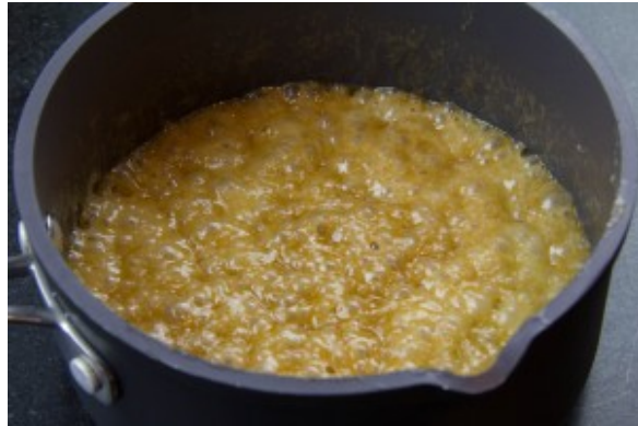
Le caramel mousse

petite cuillerée à soupe d'eau. Laissez cuire.