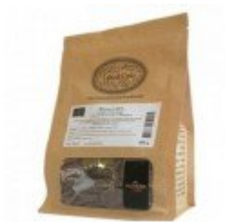
Valrhona - Manjari 64% chocolat noir de couverture pur Madagascar fèves 500 g