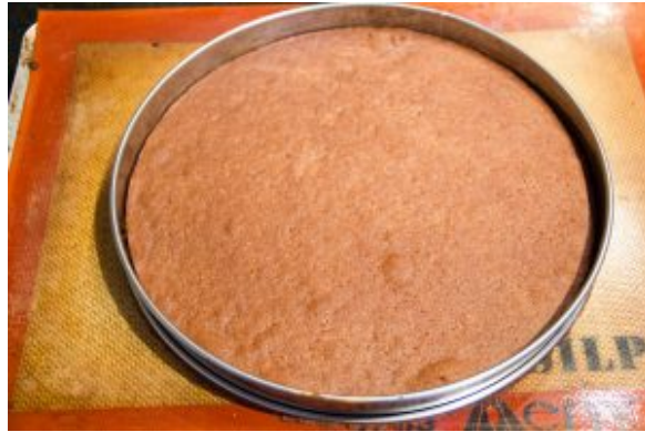
Le fond de tarte est cuit