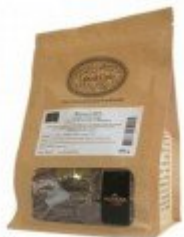
Valrhona - Manjari 64% chocolat noir de couverture pur Madagascar fèves 500 g