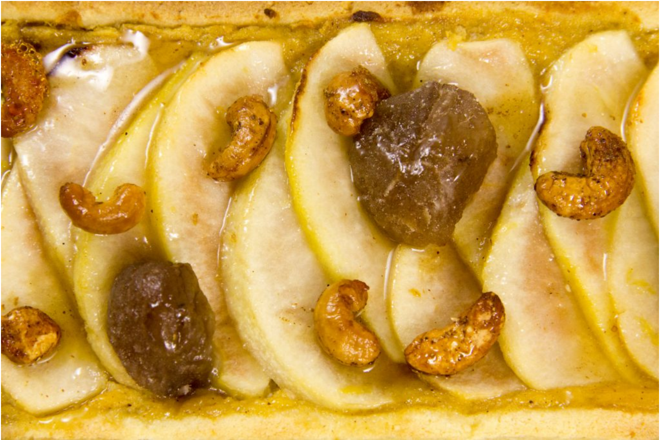
Tarte d'automne (potiron, marrons glacés et poires)