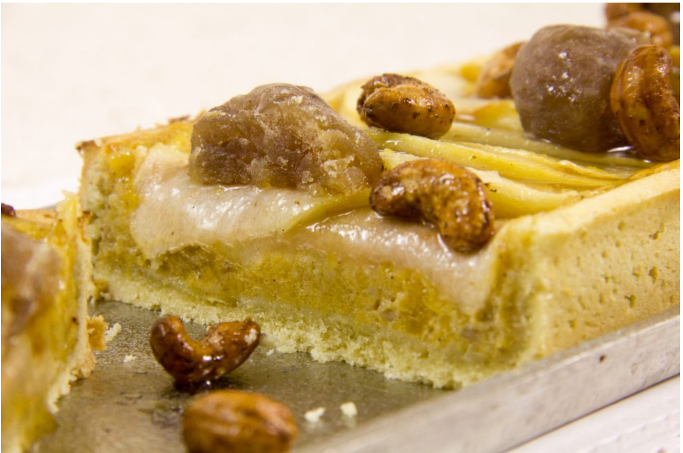
Tarte d'automne (potiron, marrons glacés et poires)