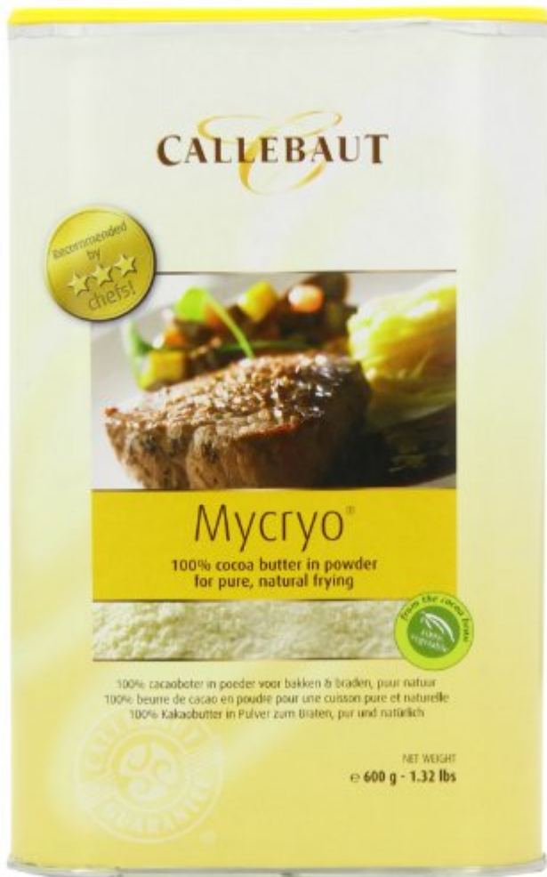
Poudre de beurre de cacao Callebaut Mycryo 600 g