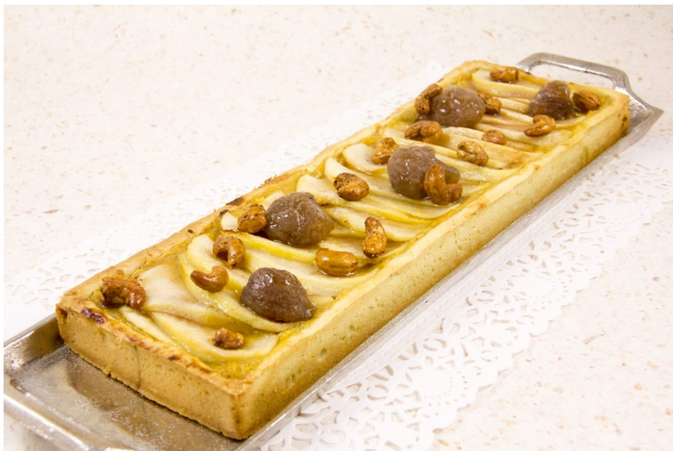
Tarte d'automne (potiron, marrons glacés et poires)

J'avais envie d'un dessert un peu original et surtout réalisé à partir de produits de saison: voilà comment est née cette tarte à base de potiron, marrons glacés et poires. Essayez-la, vous allez l'adopter avec bonheur car ma Tarte d'automne est vraiment très gourmande! Servie avec une petite quenelle de glace vanille...Miam!