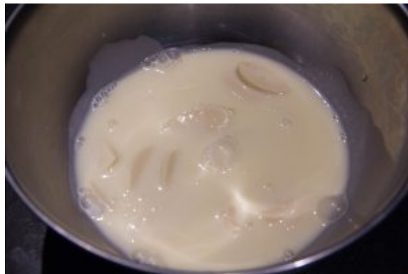
Versez le tout sur le chocolat en morceaux