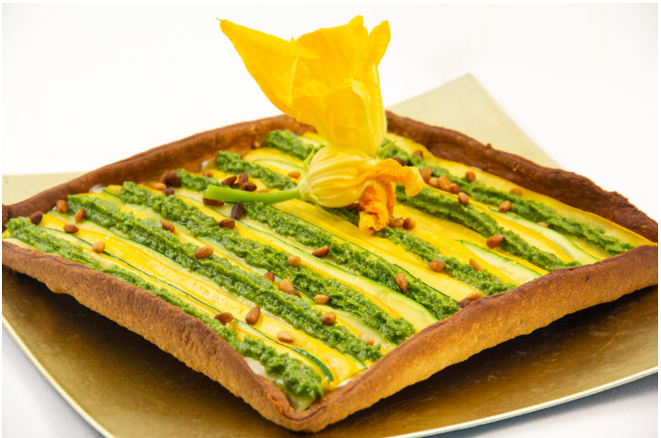
Tarte fine courgette, fromage frais, pistou