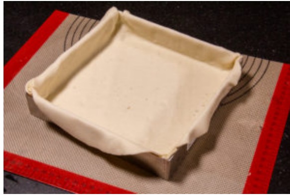
Foncez votre cercle à tarte