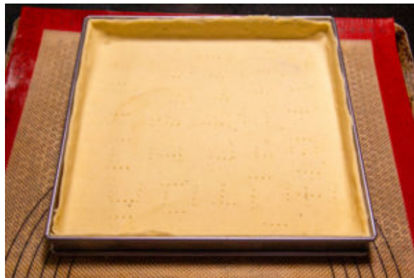
A l'aide d'un couteau coupez le trop plein de pâte