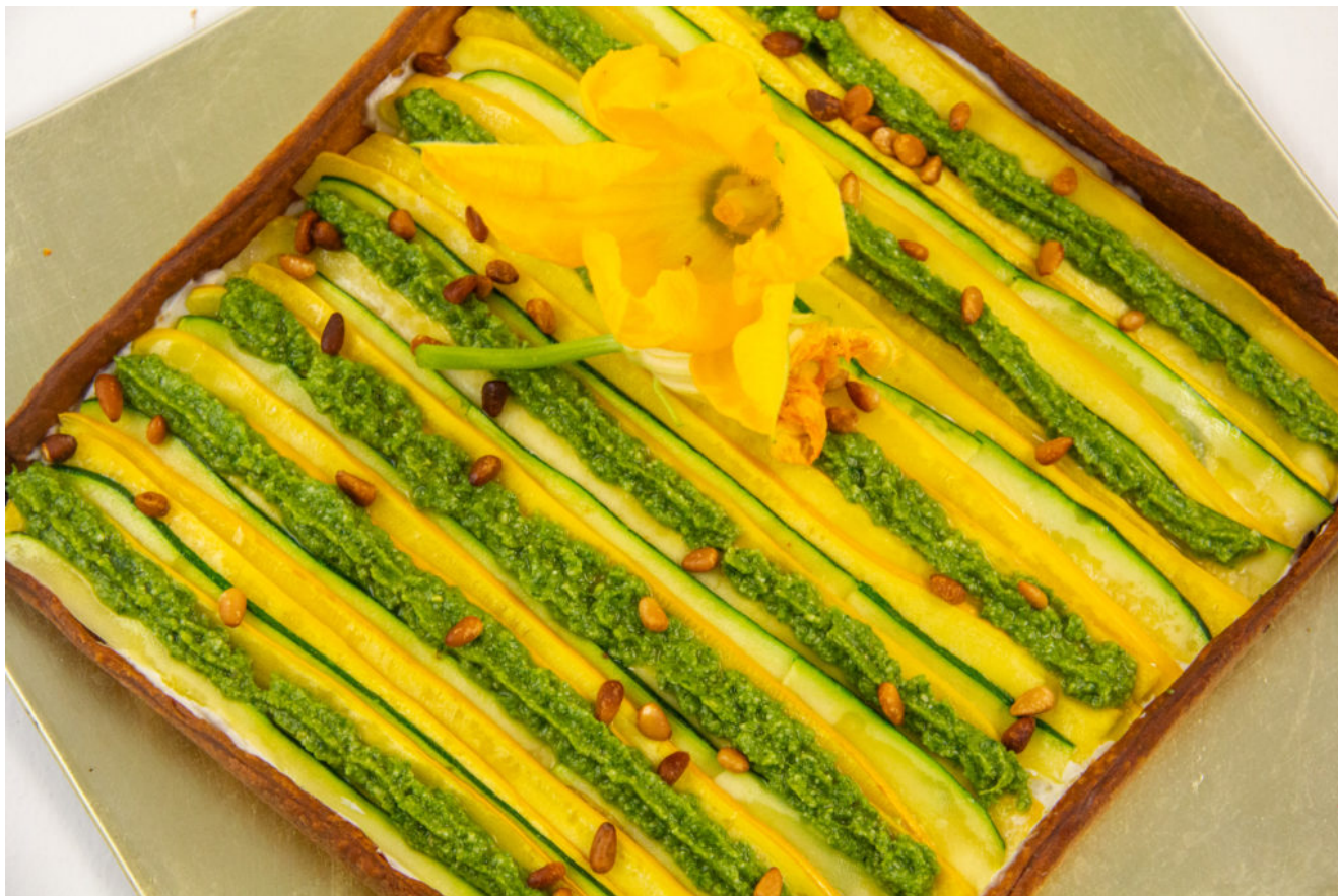
Tarte fine courgette, pistou

Une superbe tarte ultra gourmande! Non seulement elle va provoquer un « Waouh » général mais elle est tout simplement sublime, à la fois croquante et moelleuse.