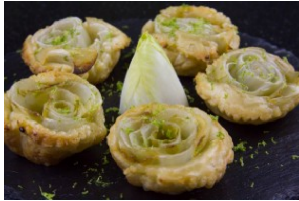
Tatin d'endives aux pommes

Voici la recette originale d'Alain Passard en vidéo: