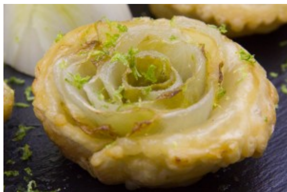
Tatin d'endives aux pommes

Vous pouvez les servir à l'apéritif, en entrée, accompagnées d'une salade de mâche au magret fumé ou tout simplement en accompagnement d'une viande blanche .