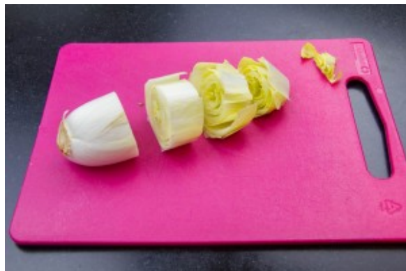
Tranchez les endives