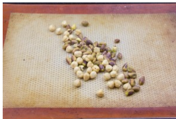
Torréfiez les noisettes et pistaches