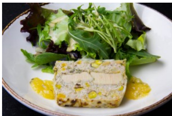
Terrine de porc et foie gras, pistaches et abricots