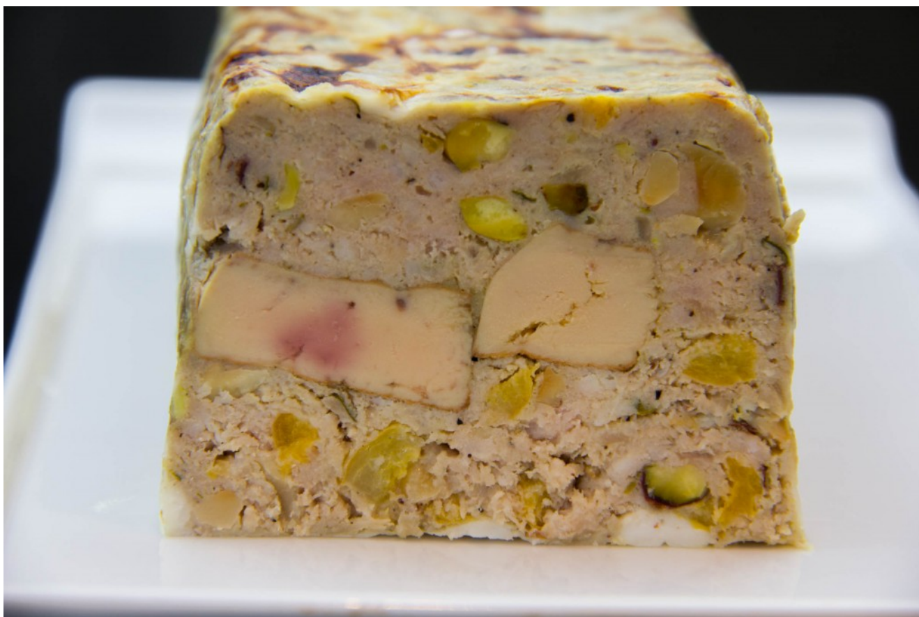
Terrine de porc et foie gras, pistaches et abricots

L'été va bientôt pointer son nez avec ses barbecues et grandes tablées entre amis. Quoi de mieux qu'une terrine pour un banquet ou un buffet! Voici cette succulente Terrine de porc succulente agrémentée de foie gras que vous pouvez réaliser soit en sous vide basse température soit de manière traditionnelle par une cuisson au four.