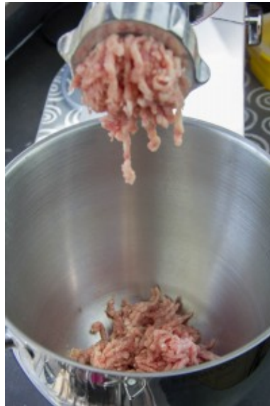
Hachez les viandes