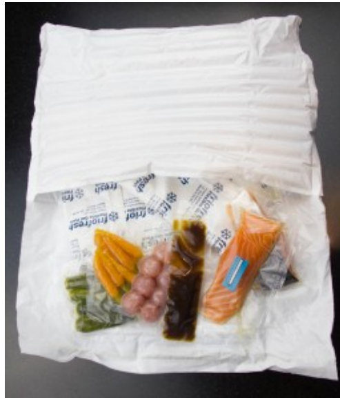
Réception du colis