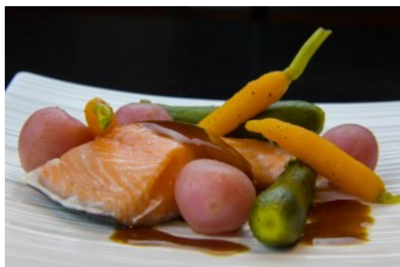
Saumon » Un dîner en ville »

Vous n'avez jamais dégusté un plat cuit basse température? Vous n'êtes pas équipé en basse température mais vous aimeriez la faire découvrir à vos amis ou votre famille? Un petit envie d'un bon petit plat mais pas envie de cuisiner ou de sortir au restaurant? Il ne vous reste plus qu'à découvrir la cuisine sous vide basse température grâce à des plats dignes des grandes cuisines concoctés par « Un dîner en ville ».