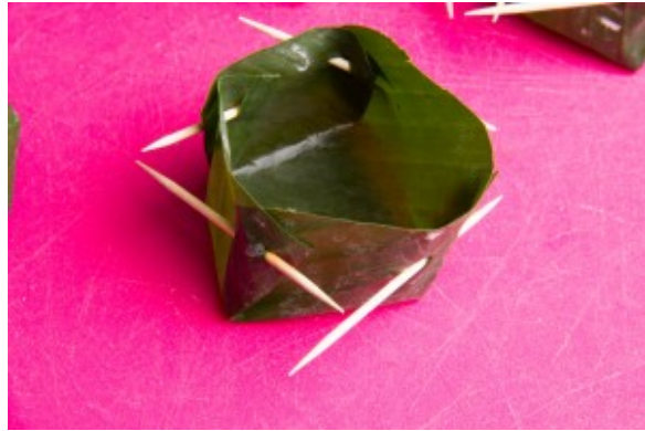
Un petit panier