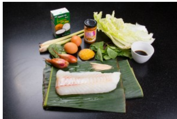
Ingrédients Mok Pa