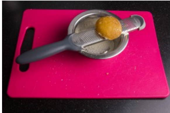
Râpez le sucre de palme