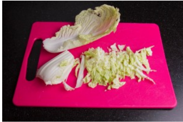
Coupez le chou