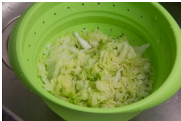
Égouttez bien le chou