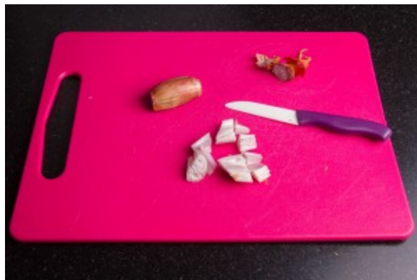
Faire de même avec l'échalote