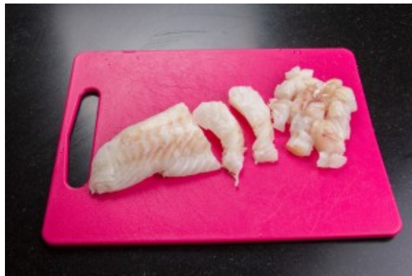
Coupez le cabillaud en petits dés