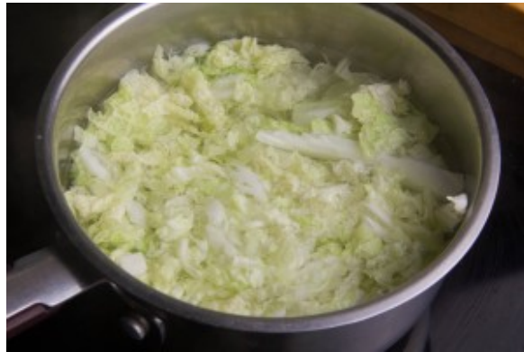
Faire blanchir le chou