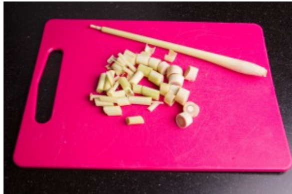
Coupez grossièrement la citronnelle