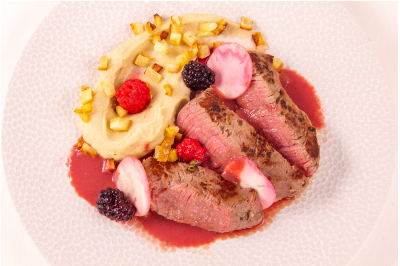
Tournedos de bœuf, céleri et fruits rouges (recette basse température)