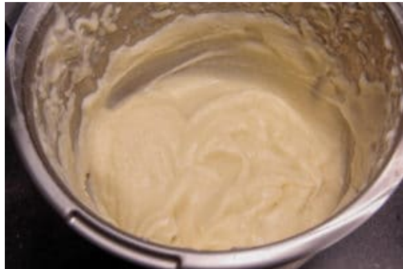
Mixez finement le céleri

vous allez entendre un petit crépitement on dit qu'il chante... Il est prêt quand il prend une couleur ambrée et une odeur de noisette. On le retire alors du feu immédiatement. Mixez finement les dés de céleri cuits dans le lait avec le beurre noisette. Rectifiez l'assaisonnement et réservez cette mousseline.