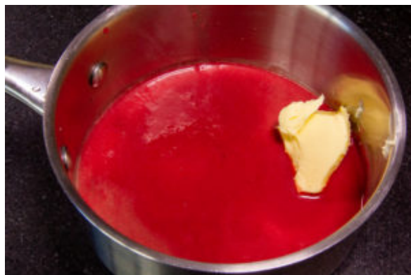
Vous monterez la sauce avec 40 g de beurre juste avant de servir