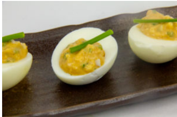
Oeuf mimosa et ma Mayonnaise fumée, arôme tomate