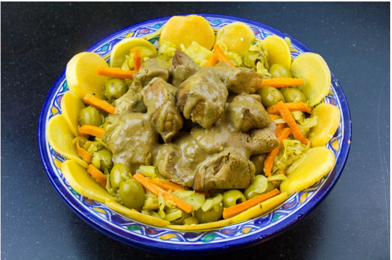
Veau aux olives et citron confit, basse température