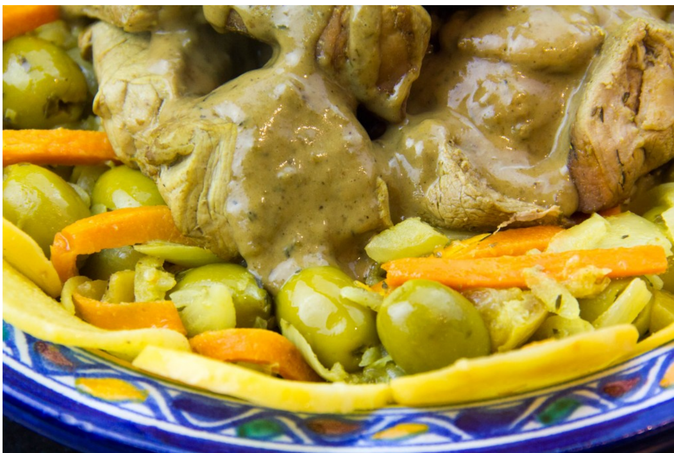
Veau aux olives et citron confit, basse température

Voici un plat extraordinairement goûteux, comme beaucoup de préparations culinaires du Moyen Orient. Cuisiné basse température, ses saveurs subliment alors la viande d'une merveilleuse tendreté... Un régal que ce Veau aux olives et citron confit.