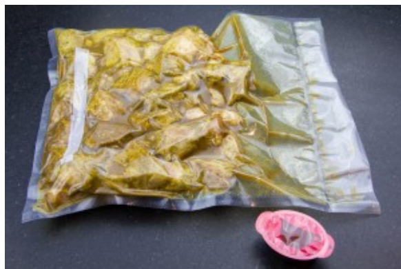
Mettre la viande sous vide