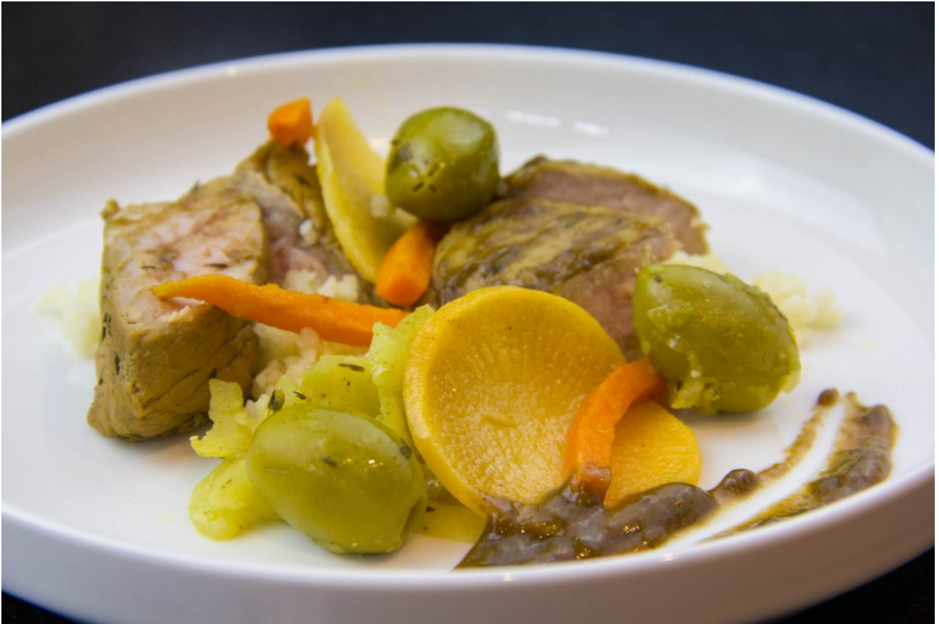
Veau aux olives et citron confit, basse température