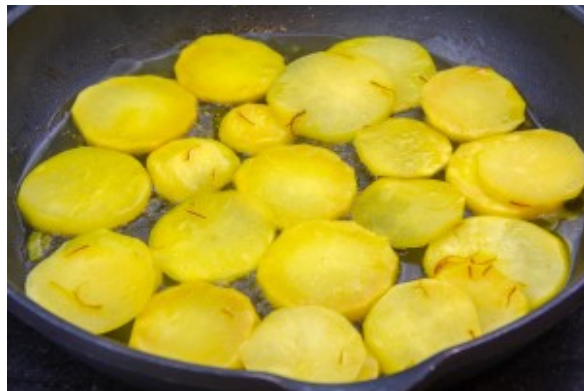
Les navets sont cuits