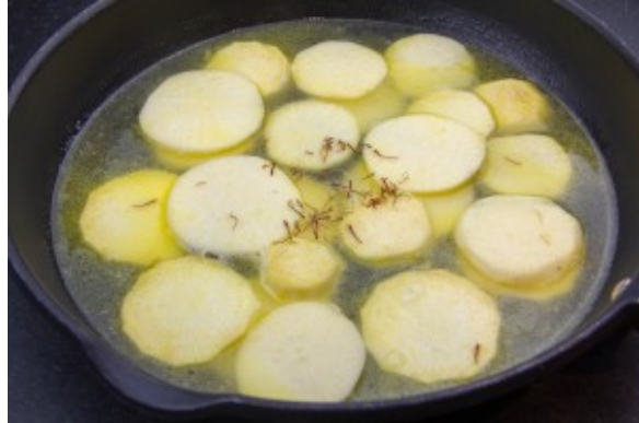
Cuire les navets à feu doux

une cuillerée à soupe de vinaigre de riz et les pistils de safran. Ajoutez de l'eau à hauteur. Cuire à feu doux. Les navets sont cuits dès que vous plantez facilement une pointe de couteau dedans. Réservez les.