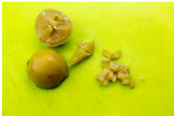
Coupez les citrons confits