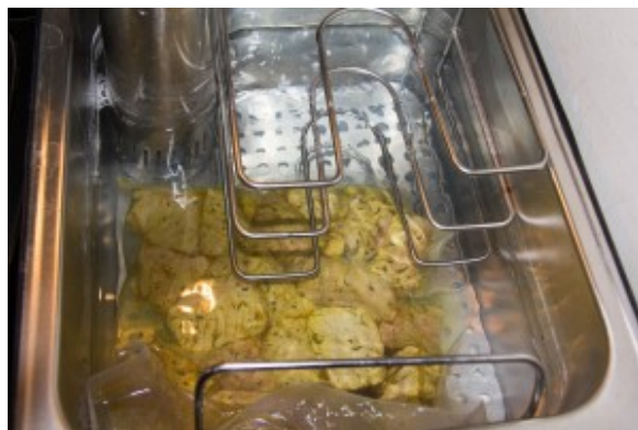
Cuire la viande sous vide

Pendant cette cuisson longue de la viande préparez vos légumes et la graine de couscous. Pour la graine: