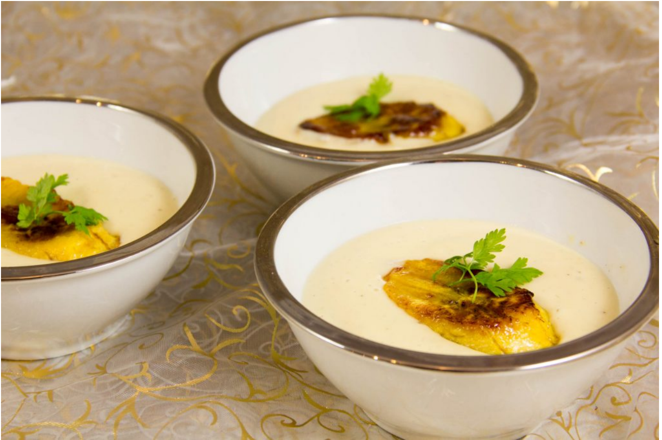
Velouté de panais, banane plantain et chocolat