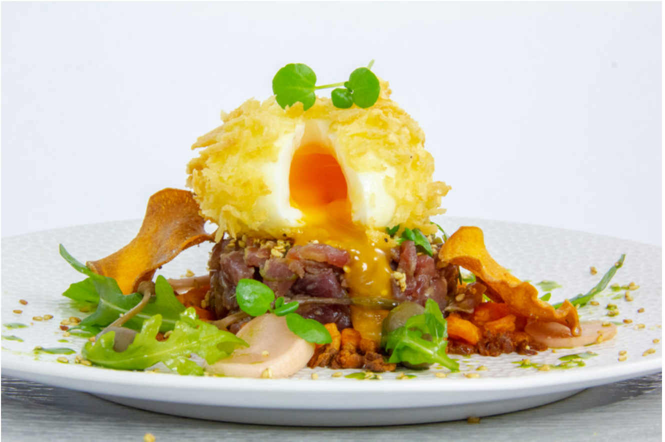
Mon tartare inattendu

Version imprimable sans photos de la recette cliquez ici