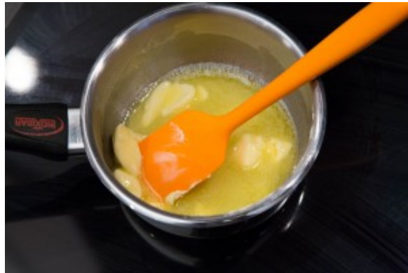
Faites fondre le beurre à feu doux.