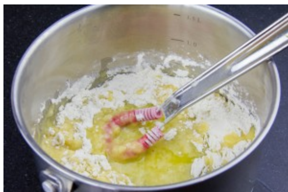
Lorsque le beurre est fondu