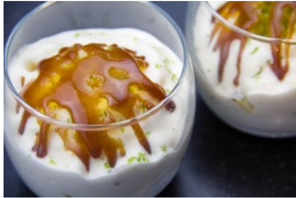
Coupe exotique et son anglaise aérienne