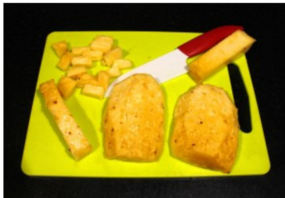
Détaillez l'ananas en cubes