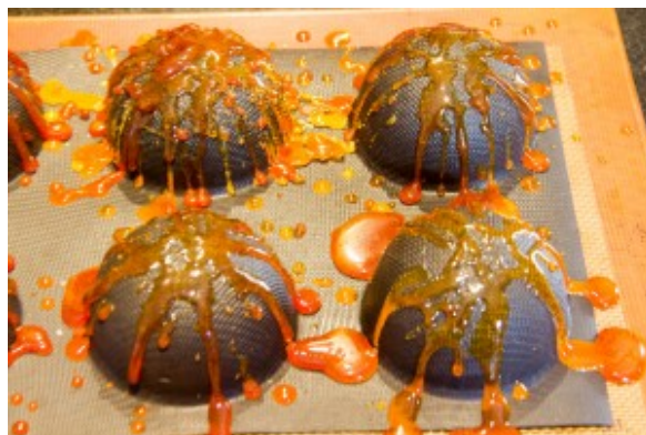
Coques en caramel