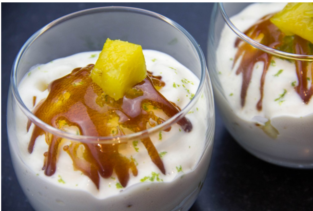
Coupe exotique et son anglaise aérienne

Aujourd'hui je vous propose un dessert en verrine, très frais et acidulé accompagné d'une crème anglaise au siphon qui apportera une légèreté incroyable à l'ensemble! Bref une jolie gourmandise que cette Coupe exotique et son anglaise aérienne!