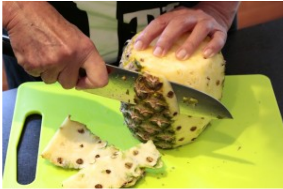
Coupez les cotés de l'ananas