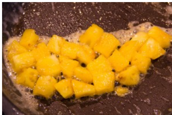
Dés ananas caramélisés