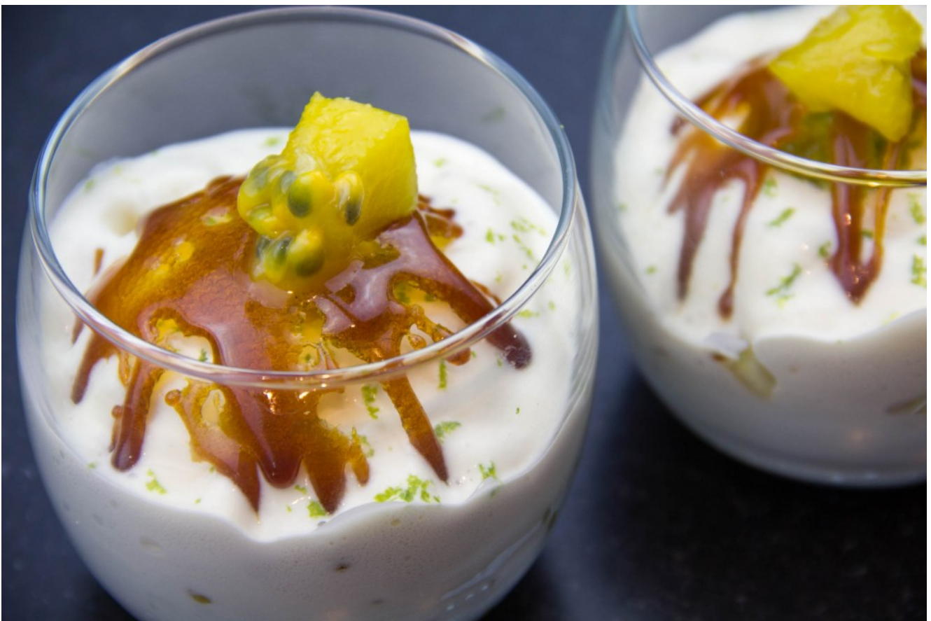
Coupe exotique et son anglaise aérienne

Comment remplir votre siphon: règles de bases et erreurs