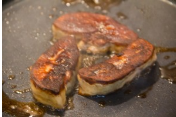
Grillez le foie à la poêle