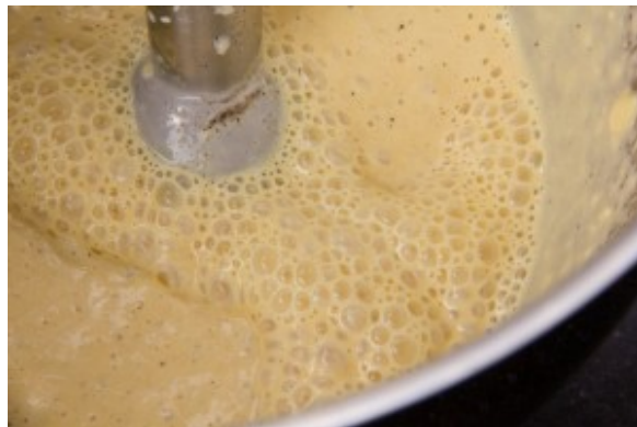
Émulsionnez la crème de maïs au mixeur plongeant