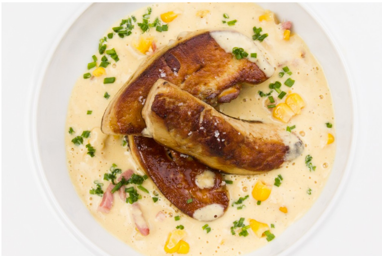
Foie gras poêlé et son coulis de maïs

Vous aimez le foie gras? Retrouvez toutes les recettes à base de foie gras en cliquant ici .