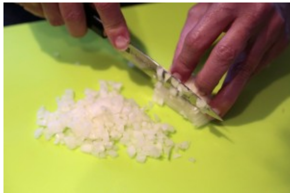
Épluchez l'oignon très finement