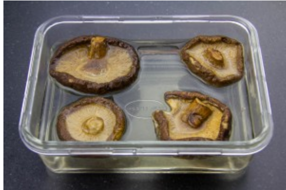
Réhydratez les shitakés