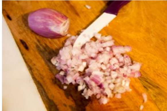
Ciselez les échalotes