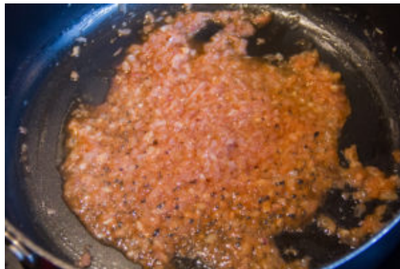
Faites revenir les échalotes à la poêle avec un peu de beurre, le vin blanc et le romarin en poudre