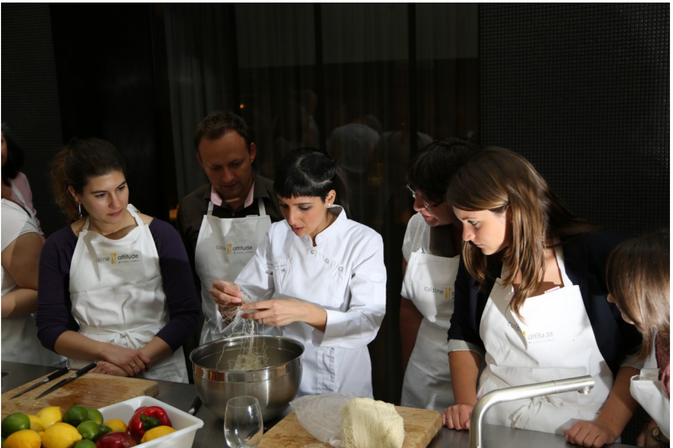
effiloquer le kadaif