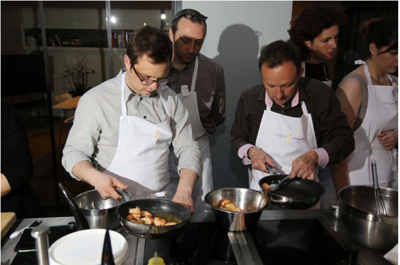
cuisson des gambas