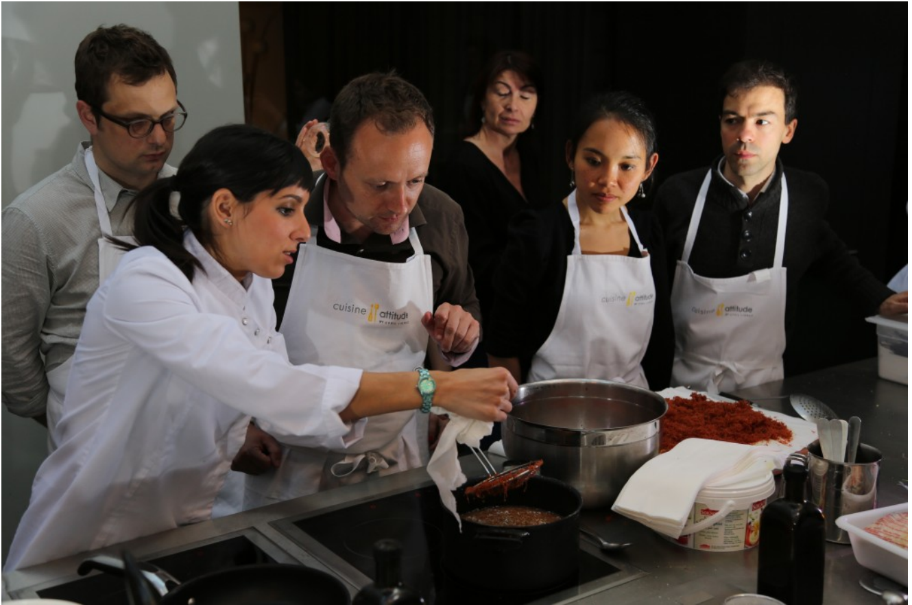
cuisson du kadaif