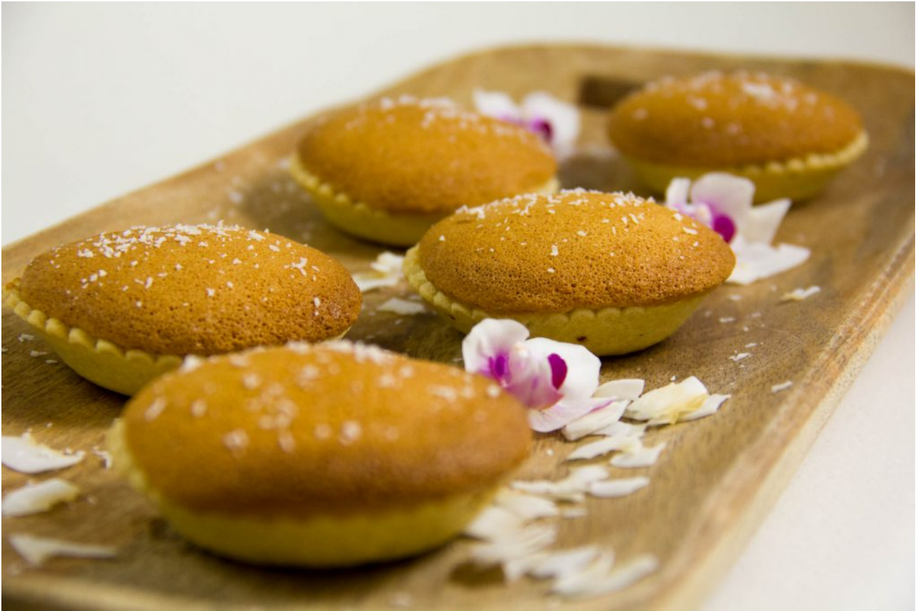
Le tourment d'amour de Mercotte (Le Meilleur Pâtissier)