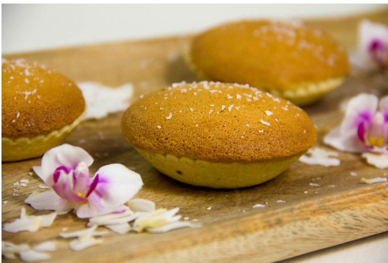
Le tourment d'amour de Mercotte (Le Meilleur Pâtissier)

Mercredi prochain dans l'émission Le Meilleur Pâtissier, Mercotte voyage dans les îles et nous propose une délicieuse petite douceur appelée "Le tourment d'amour". C'est une tartelette à base de crème pâtissière parfumée à la noix de coco et "gratinée" avec une génoise. C'est un choix étonnant car Mercotte n'aime pas la noix de coco, traditionnellement utilisée pour cette recette. Mais cette petite tartelette se décline également avec de la goyave, de l'ananas ou même de la banane. Nous découvrirons mercredi la version qu'elle aura choisie!