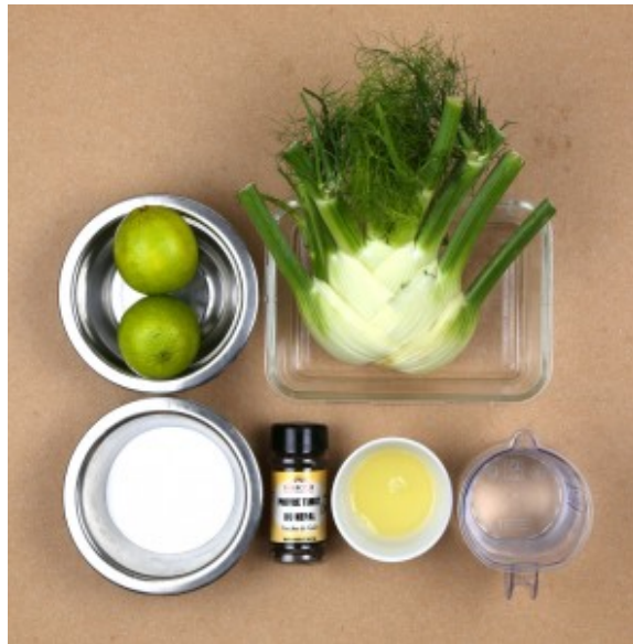
Ingrédients sorbet fenouil