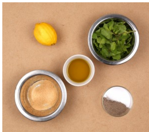
Ingrédients vinaigrette à la menthe