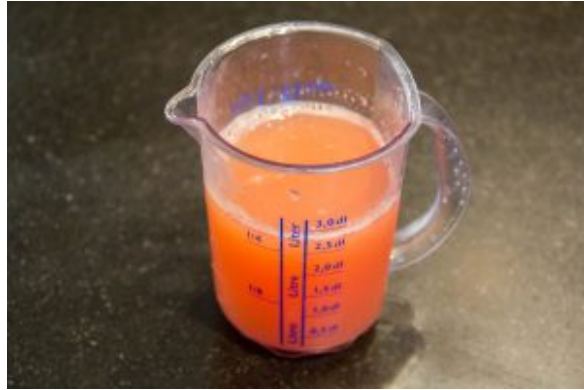
Pampleousse et sirop de gingembre