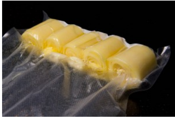
Pommes de terre après cuisson