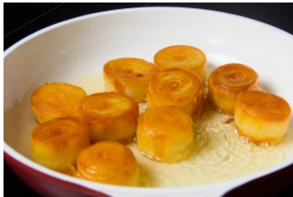
Pommes de terre en fin de cuisson