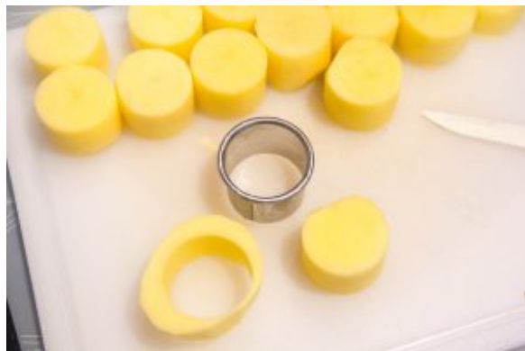
Emportepiecez les pommes de terre