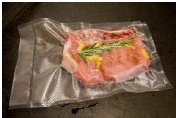
Mettre la viande sous vide