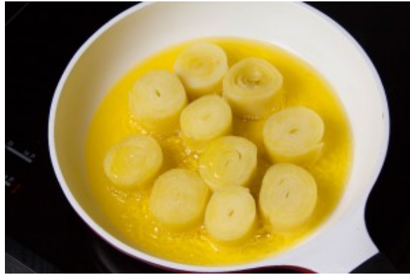
Faire revenir les rouleaux dans du beurre clarifié

avec celui-ci pendant toute la cuisson. Cuire environ 20 mn jusqu'à ce que se forme une belle coloration dorée.