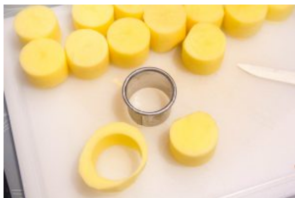
Emportepiecez les pommes de terre