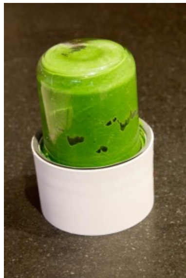
Mixez le persil