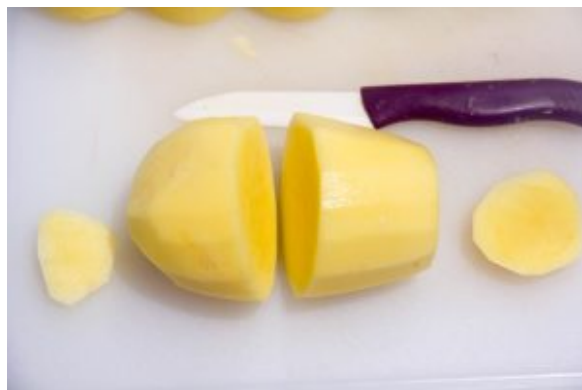
Taillez les pommes de terre

Si vous n'avez pas de machine Chiba: taillez et emportepiecez les pommes de terre.