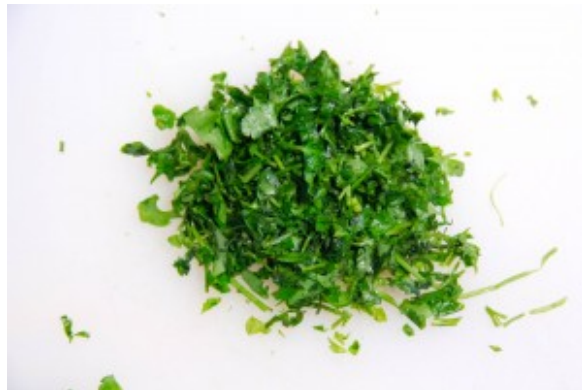
Ciselez des feuilles de persil