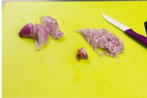
Ciselez les échalotes