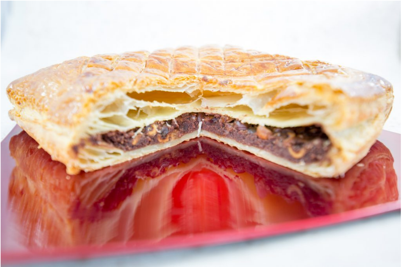
Ma gourmande galette des rois au chocolat et noisettes croquantes